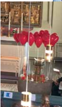
Från dopfesten 2017

• Onsdagsluncher serveras 11.30-13 under hösten 19 sept, 10 oktober, 14 november och 5 december.