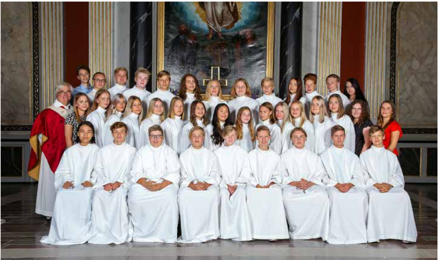
Sommarkonfirmander konfirmation 2018-07-07

2018–2019 har vi en onsdagsgrupp som börjar sin konfirmationsläsning i oktober och en sommargrupp som läser tre veckor direkt i början på sommarlovet.