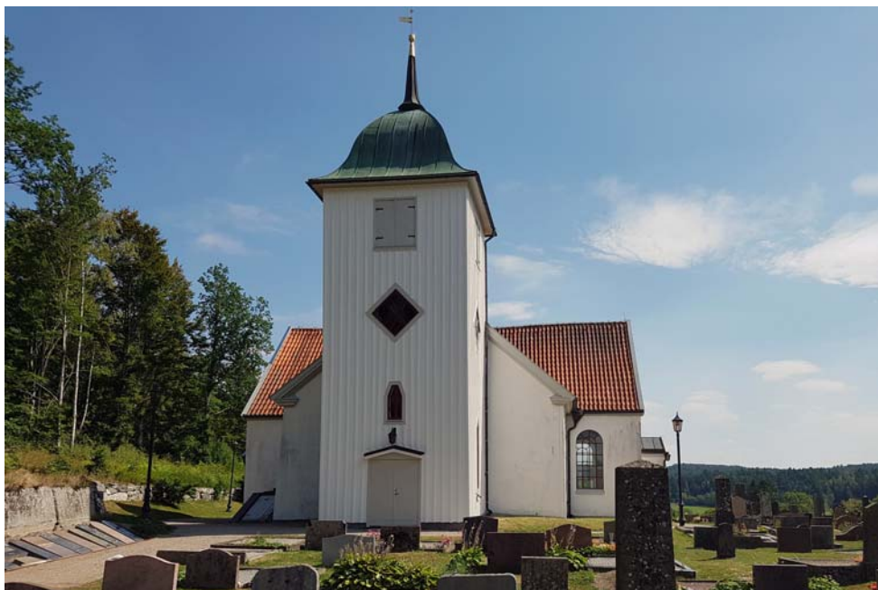
Det nyrenoverade tornet, Spekeröds kyrka