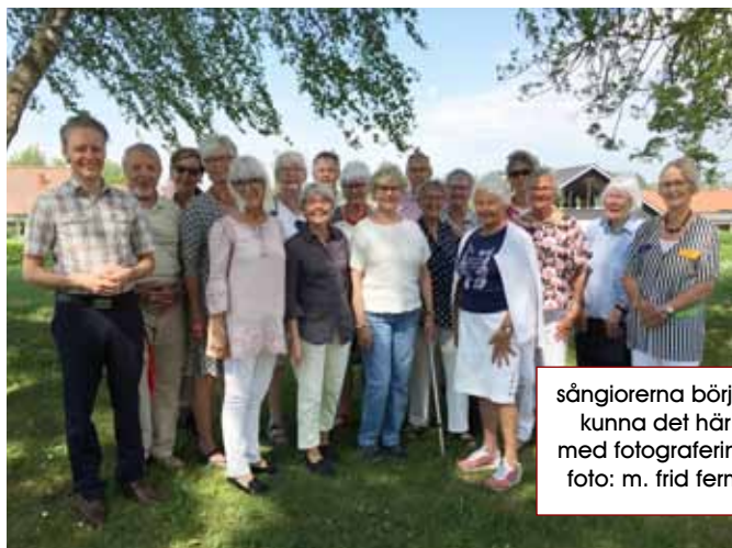
sångiöerna börjar kunna det här med fotografering