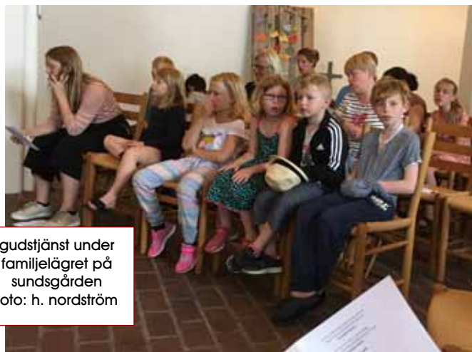
gudstjänst under familjelägret på sundsgården