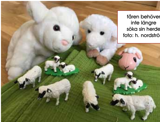
fåren behöver inte längre söka sin herde