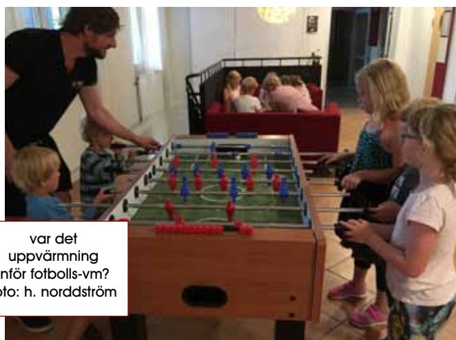
var det uppvärmning inför fotbolls-vm?