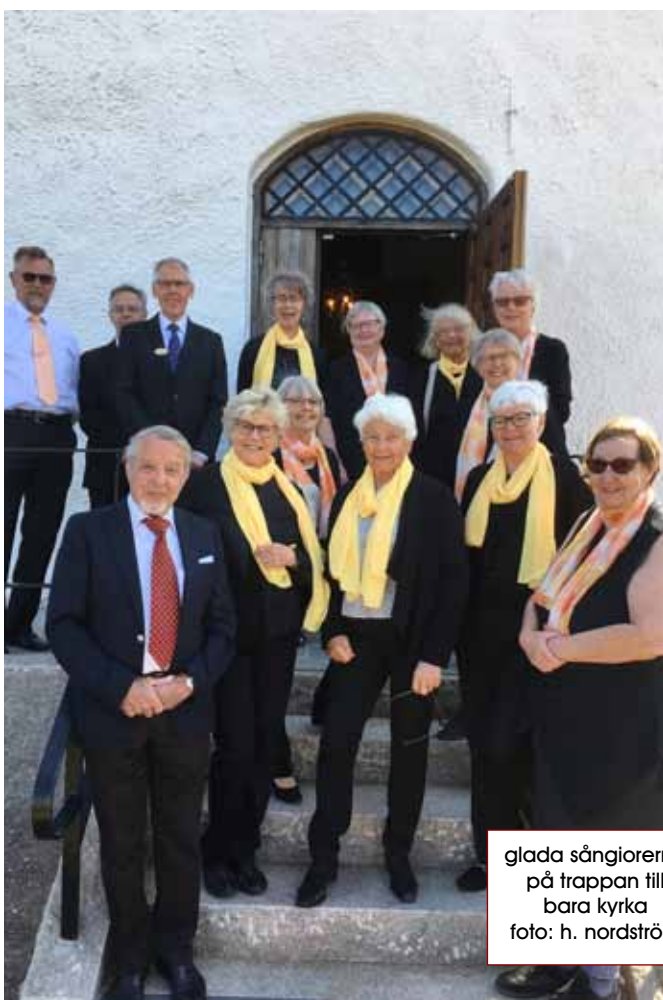
glada sångiorerna på trappan till bara kyrka