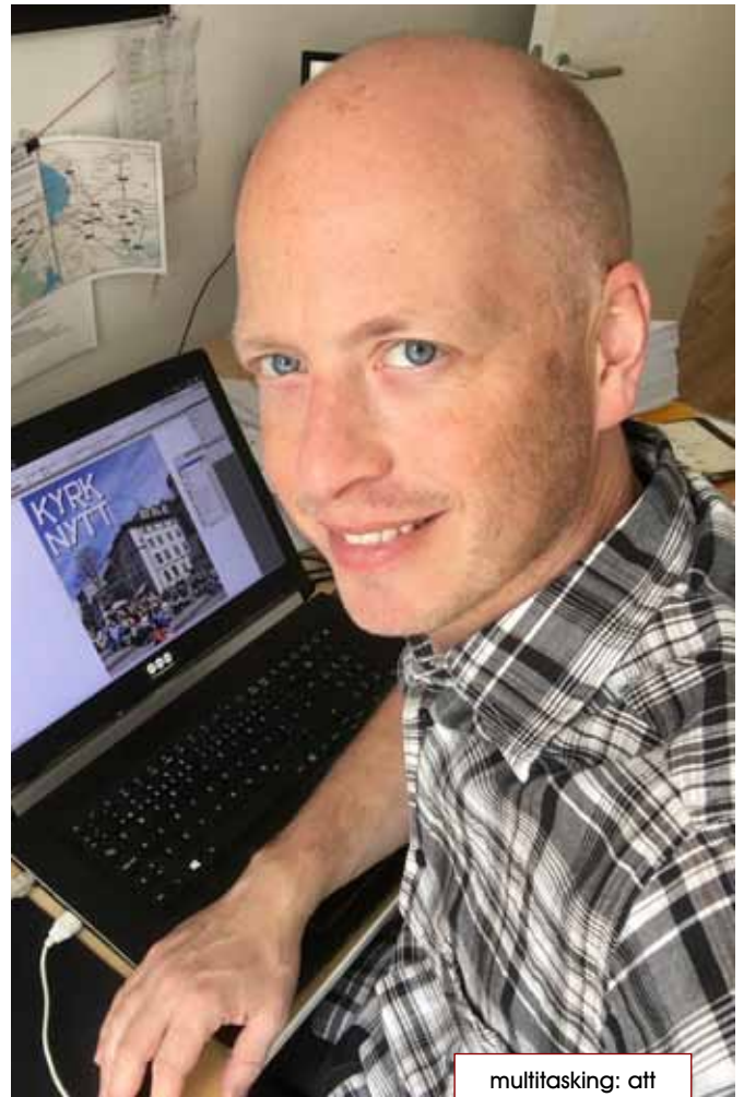
multitasking: att intervjua och fotografera sig själv

J.R.R. Tolkiens samtliga verk. Ska jag tvingas välja en enskild så är "The Children of Hurin" en favorit.