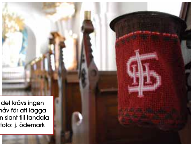
det krävs ingen häv för att lägga en slant till tandala