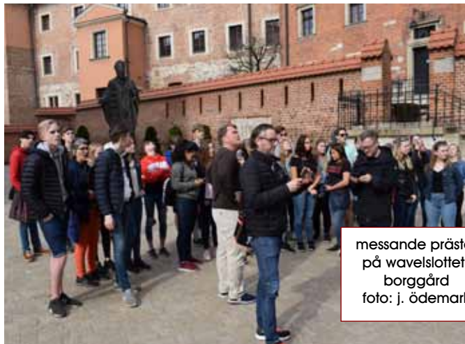
messande präster på wawelslottets borggård