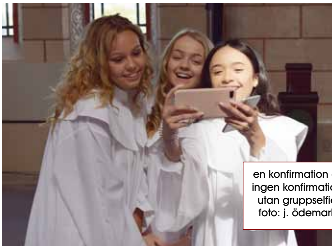
en konfirmation är ingen konfirmation utan gruppselfie