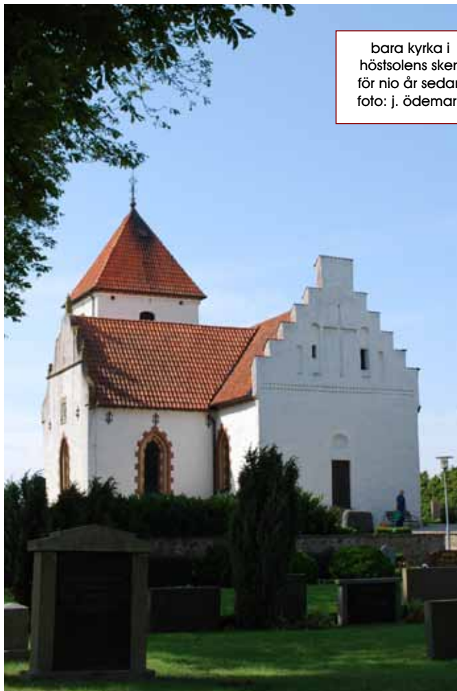
bara kyrka i höstsolens sken för nio år sedan