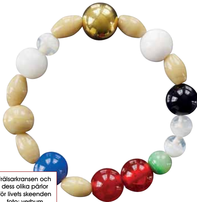
frälsarkransen och dess olika pärlor för livets skeenden