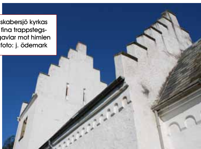
skabersjö kyrkas fina trappstegsgavlar mot himlen