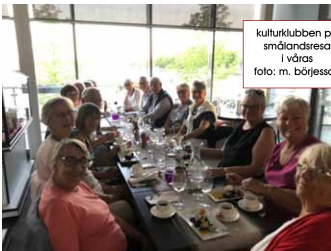
kulturklubben på smålandsresa i våras