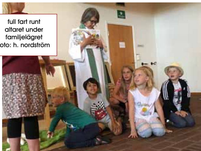
full fart runt altaret under familjelägret