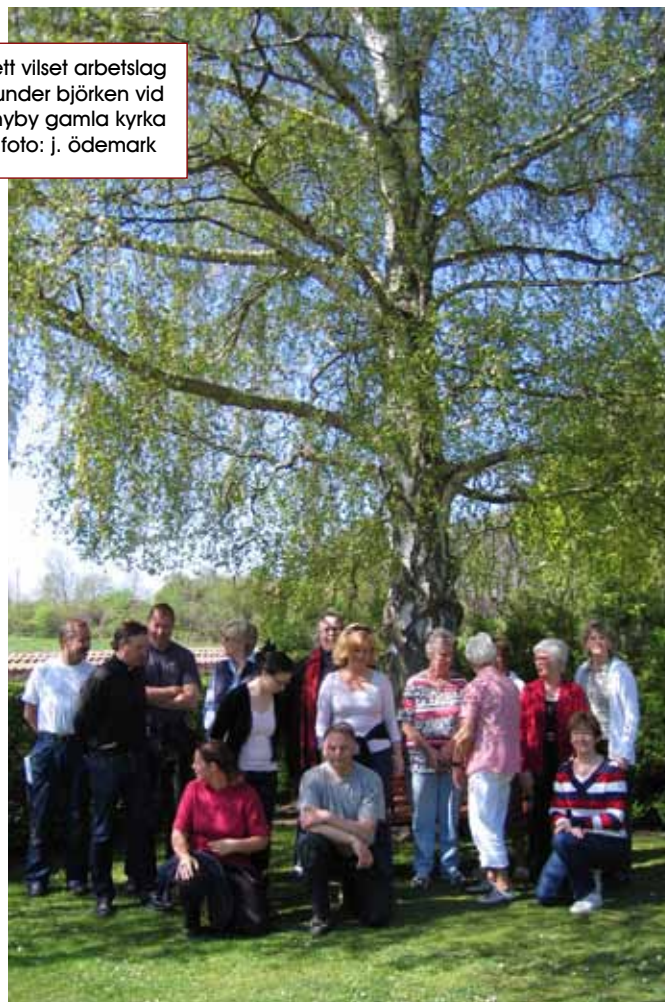
ett vilset arbetslag under björken vid hyby gamla kyrka