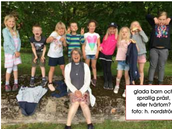
glada barn och sprallig präst, eller tvärtom?