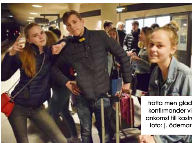
trötta men glada konfirmander vid ankomst till kastrup