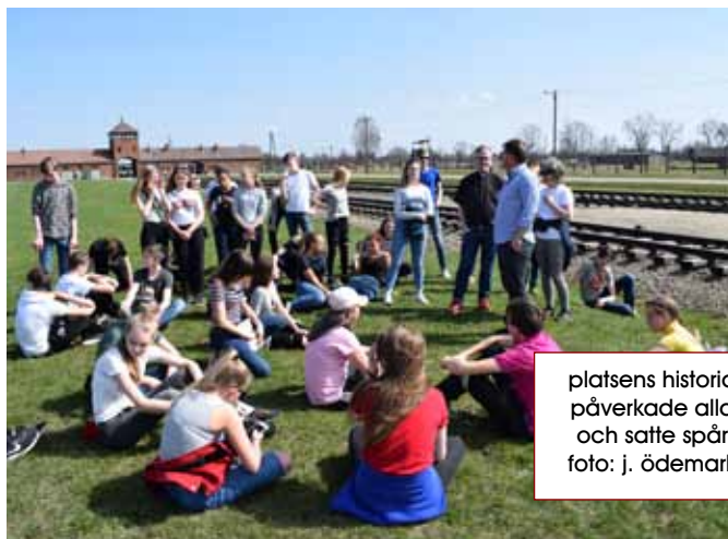
platsens historia påverkade alla och satte spår