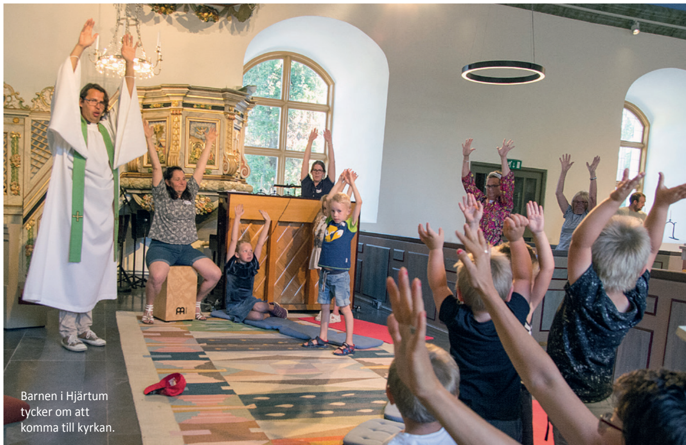
Barnen i Hjärtum tycker om att komma till kyrkan.