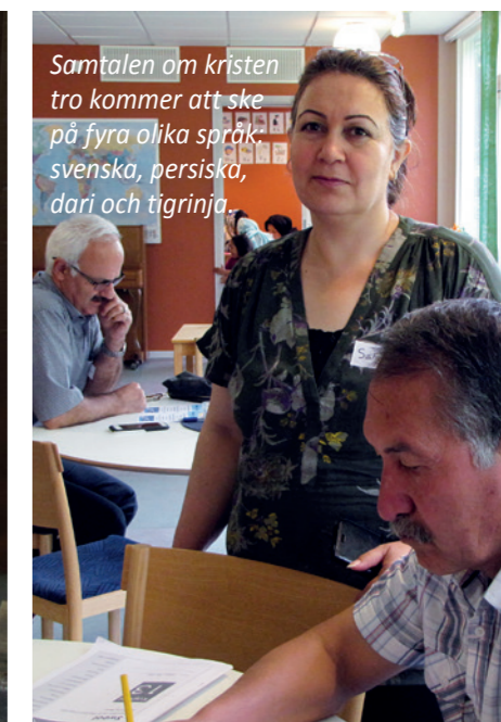
Samtalen om kristen tro kommer att ske på fyra olika språk: svenska, persiska, dari och tigrinja.

På tisdagskvällarna i höst kommer Fuxerna församlingshem att sjuda av liv och samtal om den kristna tron.