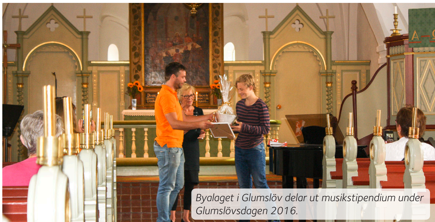
Byalaget i Glumslöv delar ut musikstipendium under Glumslövsdagen 2016.

Motorvägen E6/E20 går genom församlingen parallellt med kusten, järnvägen likaså med en bana väster om motorvägen och en bana öster om motorvägen. De miljöfarliga risktransporterna sker på den östra banan, med motiveringen att bebyggelsen inte är lika omfattande som vid den västra järnvägen. Regionbuss har fyra linjer, varav tre mellan församlingen och Helsingborg samt en linje från Helsingborg till Landskrona som går utmed Landskronavägen. Möjligheter att transportera sig med kollektivtrafik är goda norrut och söderut. Vill man ta sig österut, respektive västerut är man hänvisad till bil, cykel eller apostlahästarna.