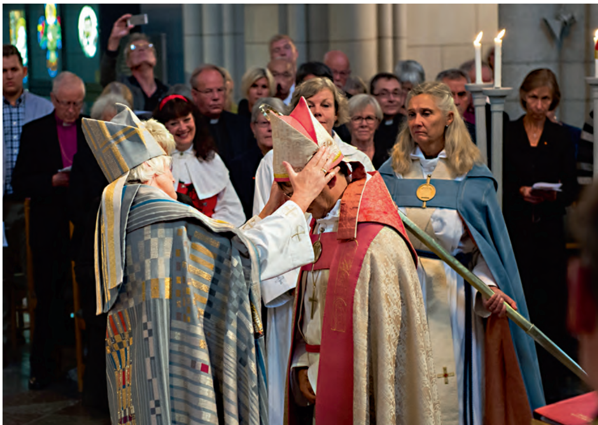
Biskopsvigning i Uppsala domkyrka.

sitt egna stift, där bland annat överläggningar med de andra biskoparna ingår.