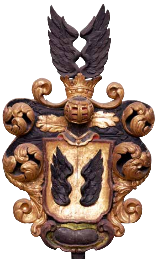
17. Mödernevapen: Två svarta vingar på guldbotten är familjen Brahes vapen.