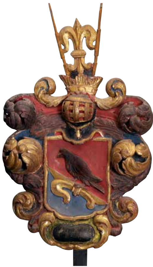
19. Ätten Lilliehööks vapen: en hök i silver, numera svartnad och en halv guldlilja (nr 4).