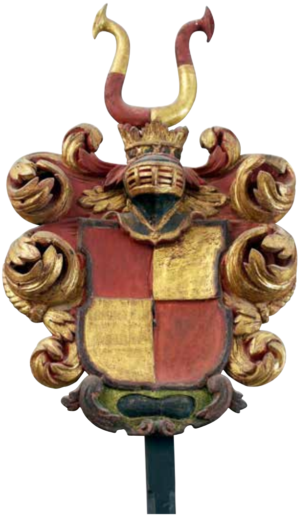
23. En sköld kvadrerad i rött och guld tillhörande familjen Thott, en av moderneanorna (Jfr nr 6).