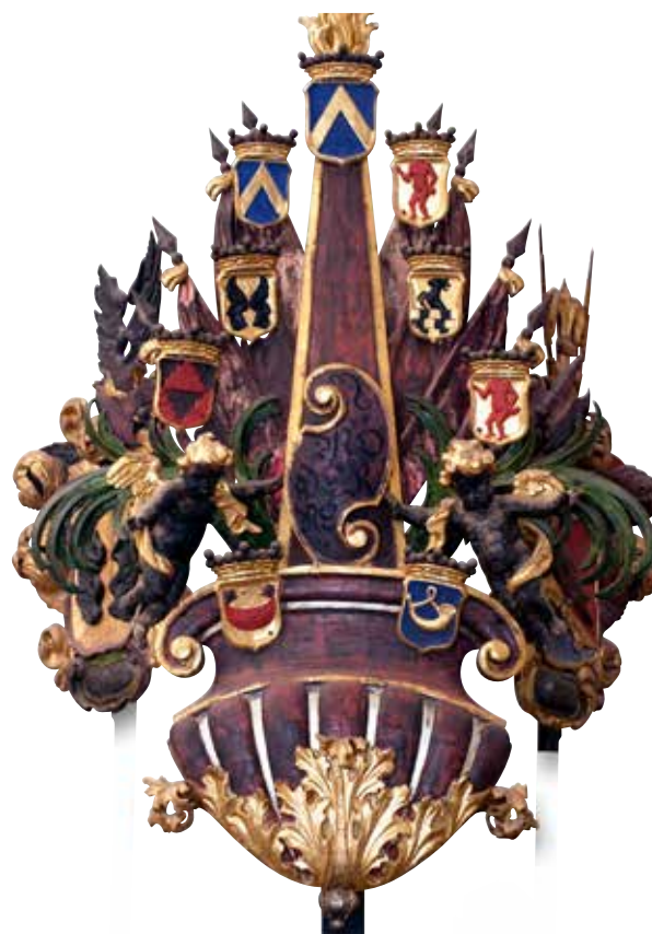
18. En pyramid med Johan Gabriel Banérs moderneanors vapensköldar. Johan Gabriels mor var född Margareta Sparre. Pyramiden börjar därför med hennes släktvapen: i blått fält en sparre i guld.

Sedan följer Trolle (se nr 5), Brahe (se nr 17) och Stenbock (se nr 3). Rikets ledande familjer håller av ekonomiska, sociala och emotionella skäl ihop.