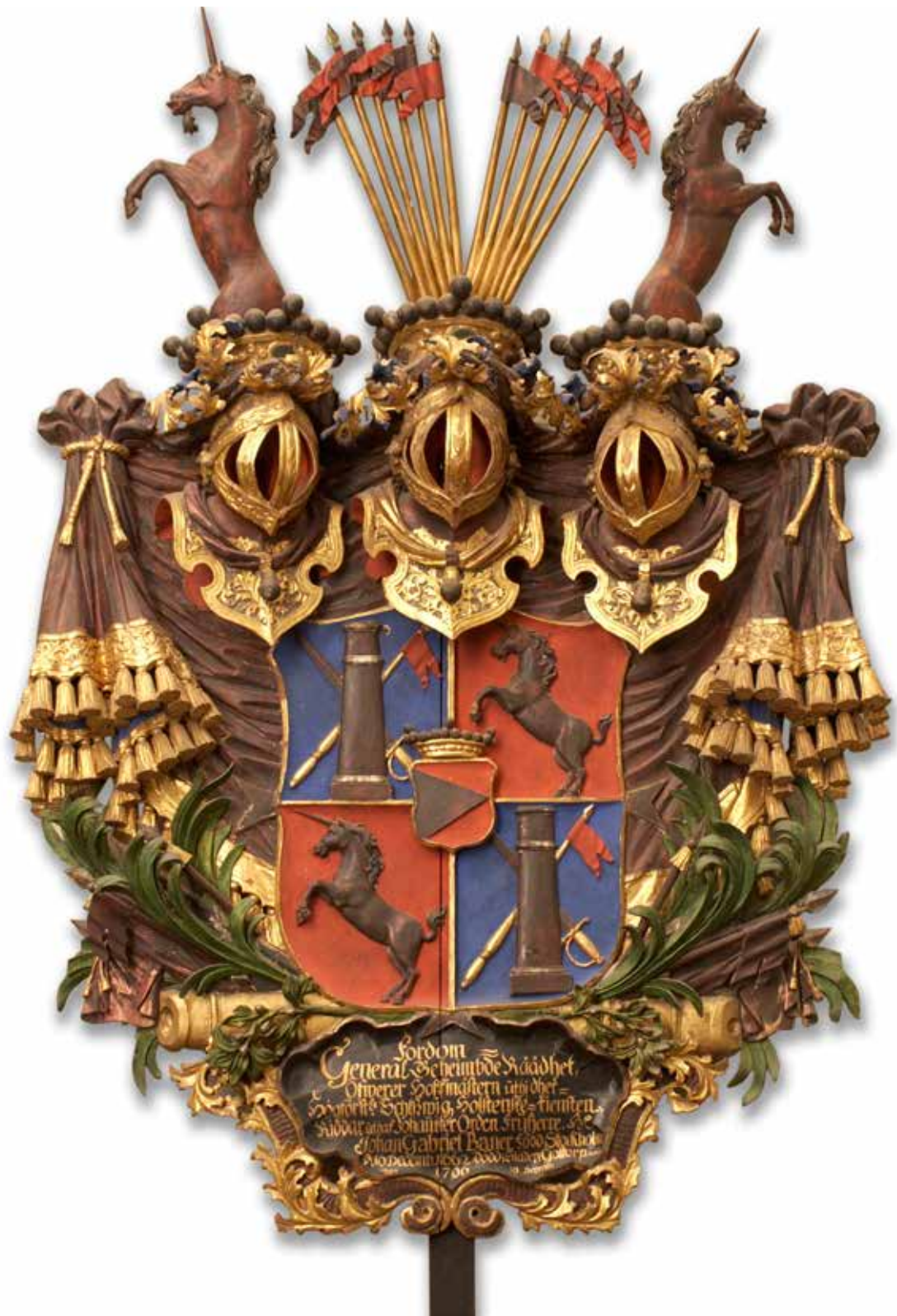
Begravningsvapen i Danderyds kyrka