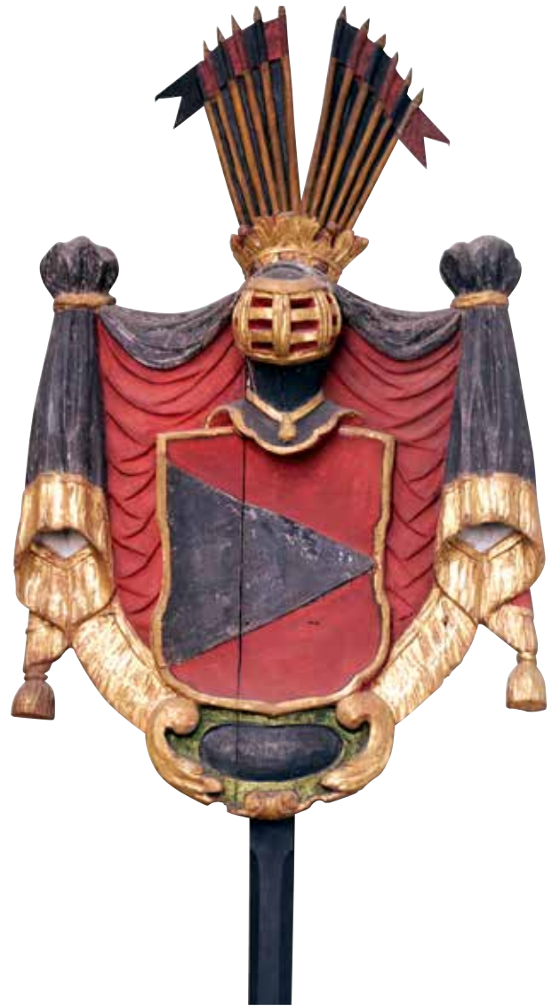
24. Sist i raden av vapen hänger, på kyrkans södra vägg närmast läktaren, en sköld tillhörande ätten Banér – en vänsterspets av silver i röd sköld – Svante Gustafsson Baners vapen.

Detta vapen kom att bli Danderyds kommunvapen 1971 och var dessförinnan Djursholms stadsvapen 1916 -1970.