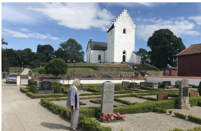
Berättat för Åke Appeltgren som också fotograferat