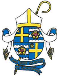
Eva Brunne Biskop