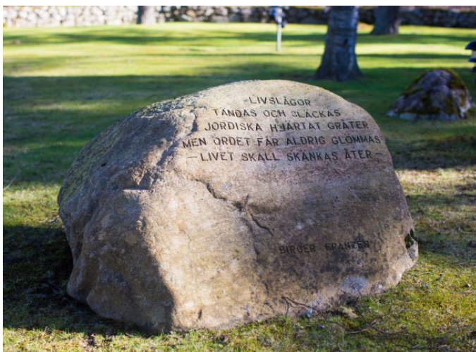
Nutida dekoration på Skogskyrkogården i Alvesta.

Den allra sämsta platsen var utanför kyrkogårdsmuren, alltså utanför den vigda jorden. Här begravdes de odöpta, de som tagit sitt liv och de som avrättats.