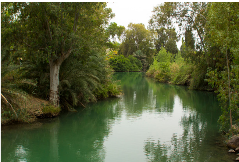
En bild från floden Jordan där Jesus döptes.