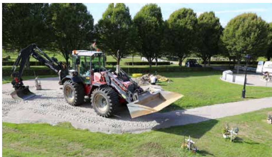
Anläggning av den nya askgravplatsen

blommor. Borttagning av vissna blommor sköter församlingen om. Det kommer att registreras gravrättsinnehavare på varje plats i denna del av kvarteret. I skrivande stund är arbetet med den nya platsen i full gång. Vi kan dock inte säga exakt datum när nedsättning av urnor kommer att kunna påbörjas.