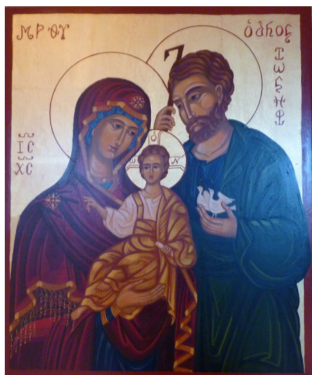
Den Heliga familjen