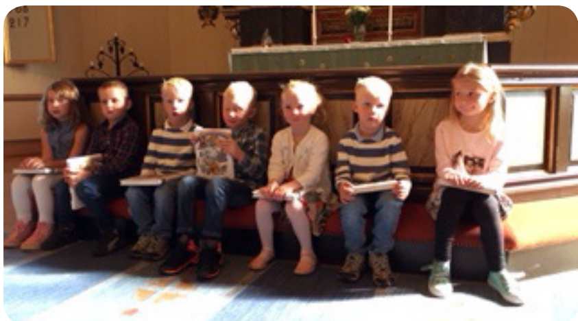
Bibel för barn delades ut till församlingens 5-åringar i familjegudstjänsten 23 september