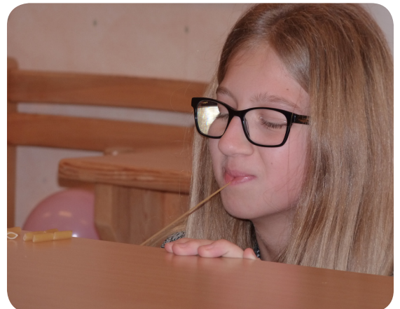
Matilda försökte också koncentrera sig