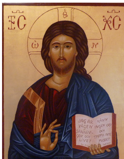
Jesus som Pantokrator