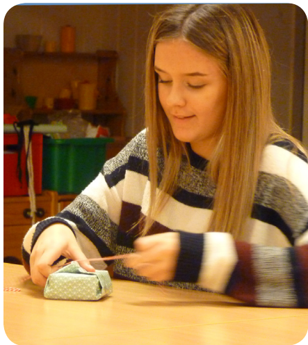
Tilde slår in ett paket utan tejp, inte det lättaste