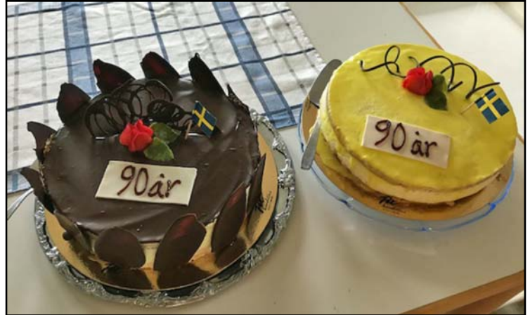
Tisdagen den 23 oktober firades församlingens 90-åringar i Drothems församlingshem.