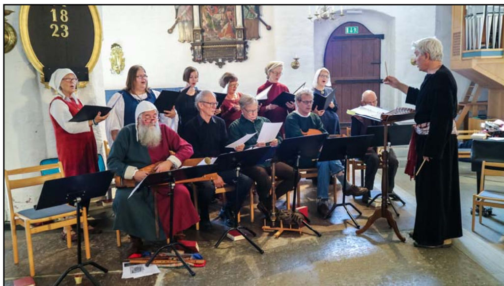
I den medeltidsinspirerade mässan framfördes latinska hymner av kursdeltagarna i sång och spelkursen "Carmina Burana" under ledning av Veikko Kiiver.