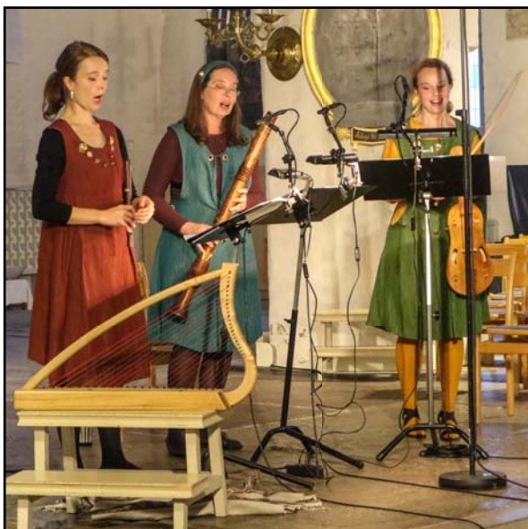
Lördagen den 1 september var det den finländska trion Sufira som framförde sång och musik från den senare delen av medeltiden.