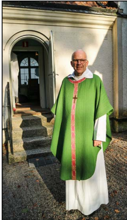
Biskop Martin Modéus utanför sakristian i Börrums kyrka vid jubileet.

Den 2 september 2018 firade Börrums lilla fina träkyrka 300 år. Själva minnesdagen var egentligen den 29 juni, men istället valdes en lämplig helg i början av september. Börrums kyrka byggdes på den kyrkogård som man invigde redan omkring 1670. Börrum tillhörde egentligen Mogata socken, men avståndet till kyrkan var så stort att det ofta var svårt att ta sig dit, inte minst