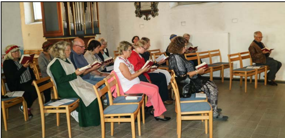
Här beds tidegårdsbönen Non (nio) kl tre på eftermiddagen lördagen den 1 september i S:t Laurentii kyrka.