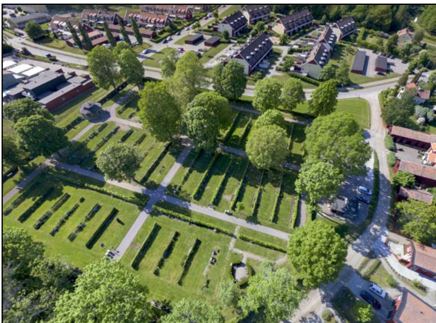
Flygfoto över Drothems kyrkogård.