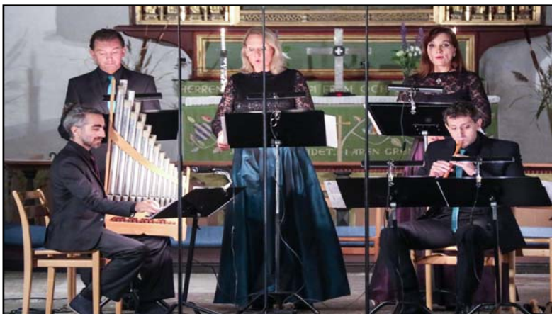
Fredagen den 31 augusti gästade den litauiska ensemblen Canto Fiorito S:t Laurentii kyrka. Deras program bestod av sentida medeltidsmusik med fokus på den flamländske kompositören Johannes Ciconia.

elfte gången och tre konserter och ett föredrag om Carmina Burana samt en kurs anordnades.