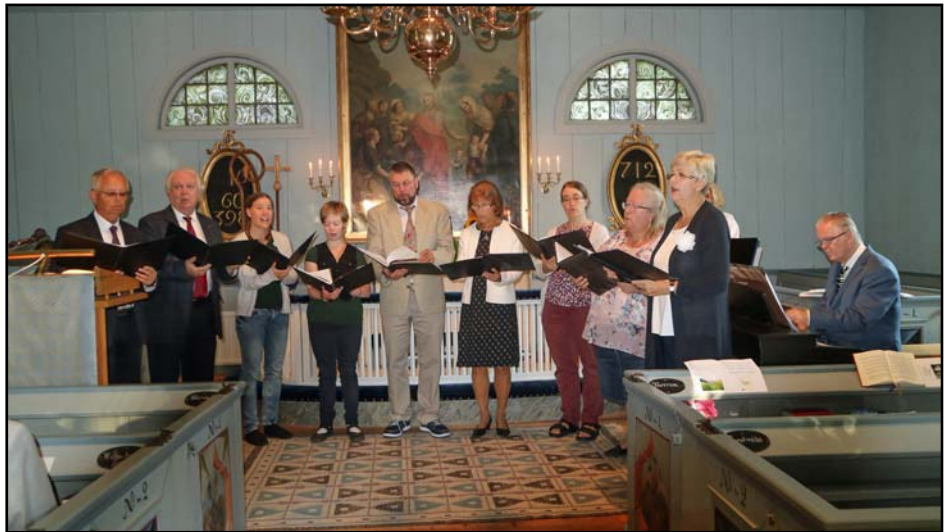
S:t Anna Vocalensemble sjunger vid jubileumsmässan i Börrums kyrka.