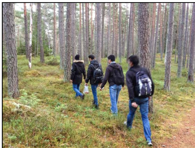
Nyfikenheten på den svenska skogen var stor. Speciellt när vi lämnade de upptrampade stigarna.

I mer än tjugo år har jag varit lärare i svenska för nykomna elever, så det språkliga var jag hemmastadd i, men de barnen var mycket yngre, och jag träffade en eller ett par åt gången.