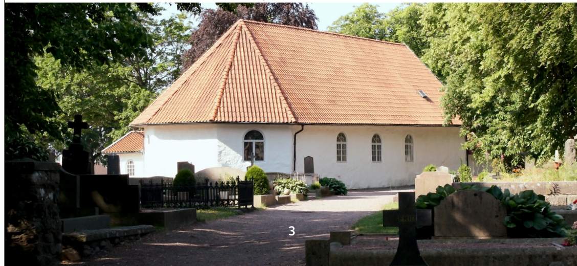
Torslanda kyrka sedd från norra sidan som vätter mot kyrkogården.

Från början var kyrkan inte bara gudstjänstlokal utan också ett slags skyddsrum. Det var orsaken till att det ursprungligen bara fanns två små fönster mot söder. Torslanda låg under medeltiden i gränsbygden mellan Norge- Danmark- och Sverige. Efter 1658 då Bohuslän blev svenskt, blev det mindre oroligt. Det gjorde att kyrkan blev "bara" kyrka. Redan före 1735 öppnade man fler fönster i långhuset. År 1835 fick kyrkan de antal fönster och den storlek på fönster som vi nu har idag.