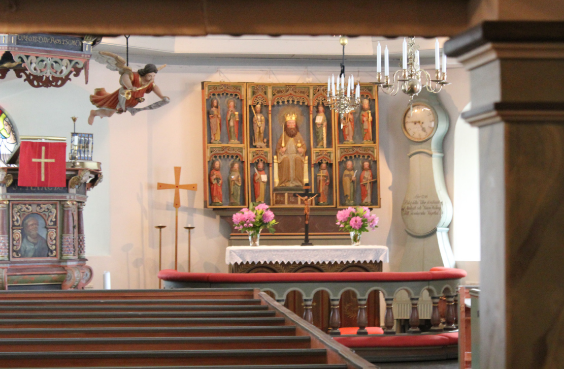
Torslanda kyrksal och altarskåpet från 1400-talet, med predikstolen och basunängeln till vänster.

Torslanda kyrka är belägen på Hisingen i Torslanda-Björlanda församling som är en del av Svenska kyrkan och därmed en evangelisk luthersk församling.