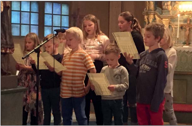
Sångfåglarna är barnkören i Nordmark och Brattfors.