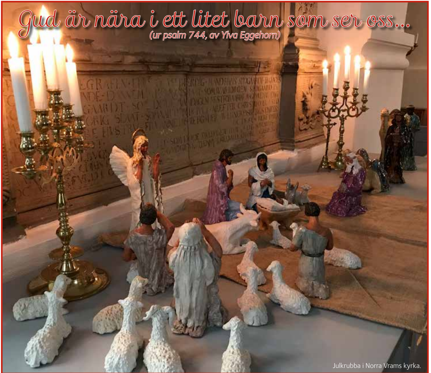
Julkubba i Norra Vrams kyrka.