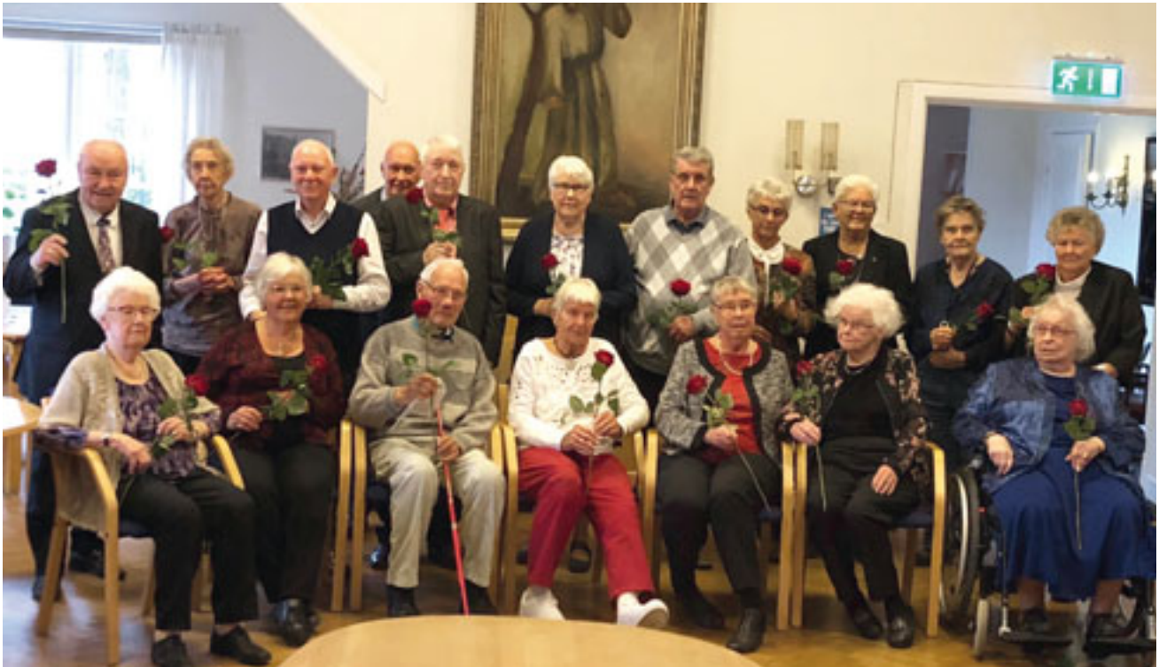
Här ser vi höstens jubilarer på födelsedagsfesten i oktober. En eftermiddag med god mat, tårta, sång och firande.