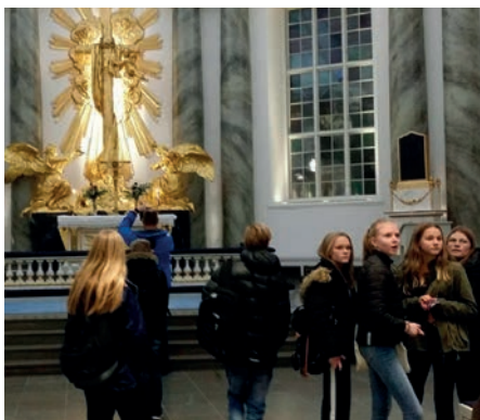
Besök i Domkyrkan.

man gör. Det var mindre bra att inte alla var drogfria. Det var kul att få träffa unika personer, såna som hade det svårt”.