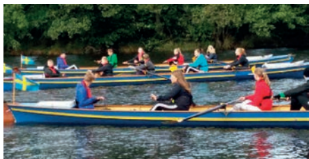
Alla konfirmander är ute och rör.

Vi gör olika lekar som gör att vi kommer ihåg bönerna”.