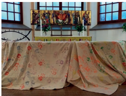
Konfahänder på altaret i Falkenberg.

”Man fick lära sig hur andra kan ha det. Vi fick jämföra den kyrkans verksamhet med vår. Jag lärde mig mycket. Bra att se att hemlösa får tak över huvudet och lite mat att äta. Man tänker: sån tur man har att man får leva sitt liv så bra som