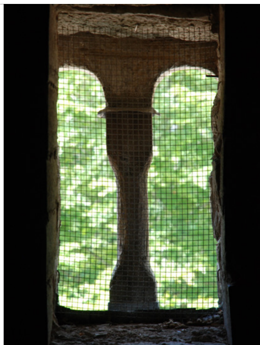
Ett av tornfönstren med en kolonnett av huggen kalksten.

haft sin bostad här, åtminstone före branden. Klockaren var personligen ansvarig för klockorna och dessutom behövde det som förvarades i tornet vaktas. Klockorna kunde också ringas från kammaren där tre hål för klocklinorna har funnits i valvet.