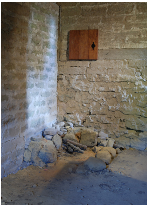
Bostadskammaren i våning 2 (en trappa upp) med rester av en ugn. Därövan syns en rekonstruerad lucka framför ett inhugget skåp som fungerat som kassaskåp.

Planet en trappa upp (2) har två tunnvälvda kamrar. Den första kammaren har fungerat som bostadsrum före branden på 1200-talet. Vid den arkeologiska undersökningen av de omfattande fyllnadslagren i kammaren konstaterades att golvet varit täckt av råghalm före branden och i detta hittades matavfall och annat som visar på bostadsfunktionen. I det nordöstra hörnet finns rester av en rökugn som eldades från gaveln och saknade