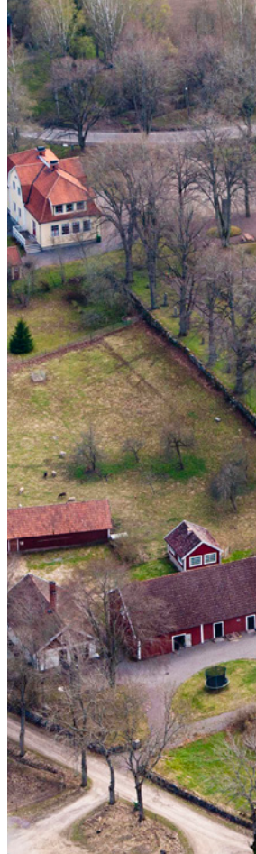
Flygbild av Bjälbo från år 2011. Hitom kyrkan syns Norrkyrkogården och oxellällen som stod vid den gamla kyrkvägen.

Jesu löfte som vi alla hörde i dopet: ”Jag är med er alla dagar till tidens slut” (Matt 28:20) är inte bundet till en viss tid i livet, eller till tider när vi var särskilt religiöst aktiva och gick ofta i kyrkan, utan är en viljeinriktning att vara med oss ständigt både i ljusa och mörka dagar. Så när världen runt kyrkan fortsätter leva, där generation efter generation förvaltar jorden och åkrarna, så är Gud närvarande och stöttande. ”Han nötte inte tröskeln i onödan” har präster som verkat i bygden fått höra av änkan i sorgesamtalet, som beskrivning varför maken inte var så aktiv gudstjänstbesökare. För många församlingsbor jag mött så är det viktigaste att kyrkan står där, att man kan uppmärksamma livets högtider där och att gudstjänsten firas så att de kan vara närvarande antingen kroppsligen om de så behöver eller i tanken. Byggnaden och gudstjänsterna blir garanten för att allt är som det skall vara och att Gud är med oss.