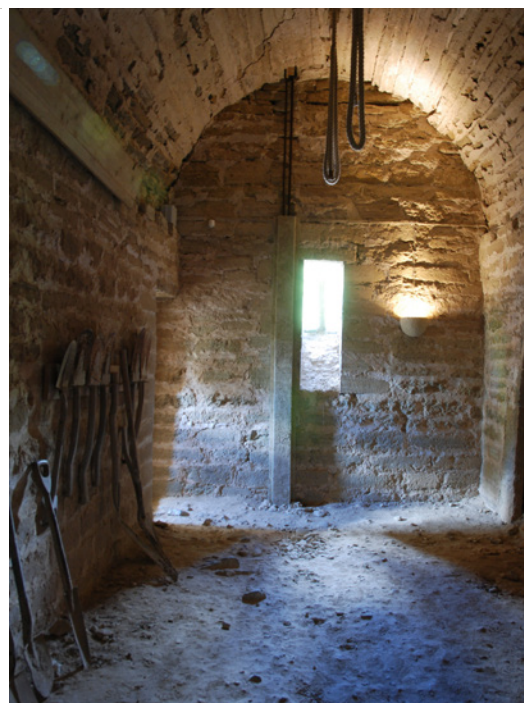
Bostadskammaren, sedd från öster. I taket hänger rep som illustrerar att klocklinorna ursprungligen gick ända ned till denna våning.