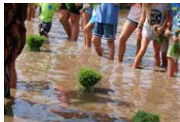
Risplantering med elever från en av de svenska skolorna.