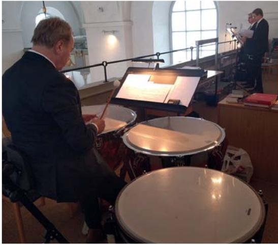
Kyrkobesökarna var många denna speciella dag. Musikerna bjöd på majestätiska toner från orgelläktaren.