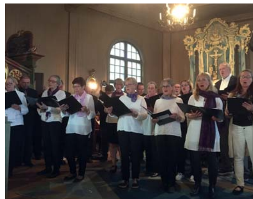
Duralux jubilerar.

Karolina Wallin Agaeus och Pelle Östlund medverkade med sång och piano vid nyårsbönen i Filipstads kyrka på nyårsaftnen. Ett fint och uppskattat program.