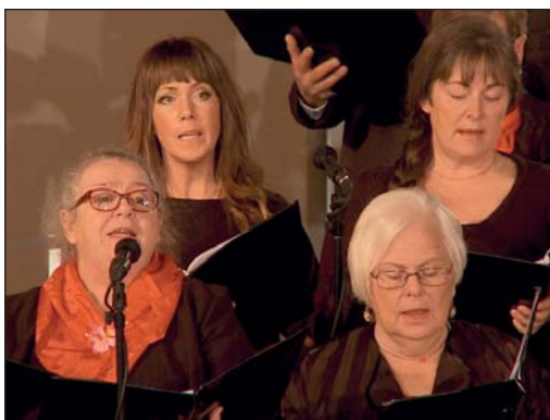
Körerna från hela församlingen sjöng alla de klassiska julsångerna och det blev en mäktig upplevelse med alla rösterna tillsammans i kyrkan.

Församlingens tre körer medverkade tillsammans med orkester och solister och insamlingen denna gång gick till Musikhjälpen.