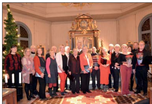
Det blev dubbelarbete för Brattfors och Nordmarks kyrkokörer.