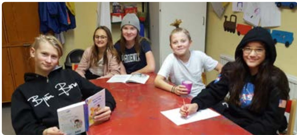
Ledarplanering i Hånger