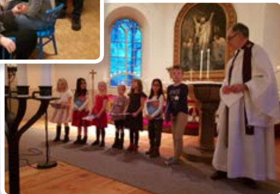
Utdelning av Barnens bibel i Kärda kyrka