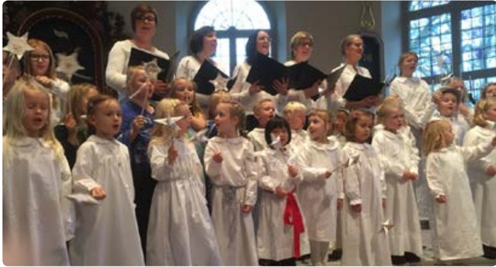
Julmusikal i Forsheda kyrka.