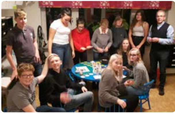
Pyssel med konfirmanderna