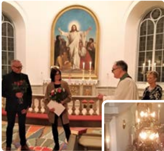
Måndax och kören sjunger in julen i Torskinge kyrka.