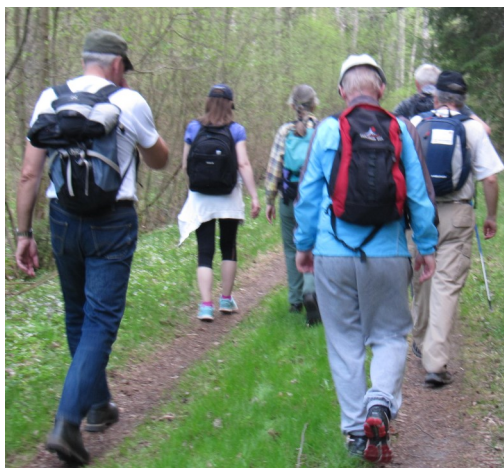
Ovan: Pilgrimsvandring till Dalbo-stugan 2018.

Nedan: Påskspel 2018 Jesus tvingas bära korset på Långfredagen. Till höger: På Påskdagen upptäcker kvinnorna att gravarna är tom, bara bindlarna är kvar.