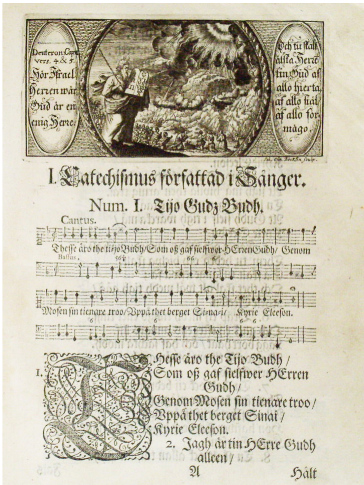
Den första psalmen i 1695 års psalmbok

hård kritik då man menade att han övergivit ett traditionellt svenskt tonspråk. Man kan förmoda att det inte stod väl till med psalmsången på den tiden. Som en sorts reaktion på detta och på Svenska kyrkans roll som monopolkyrka kom väckelsen. Denna rörelse hade egna sångböcker med betydligt mycket mer livsbejakande melodier och texter som talade ett innerlighetens språk. Det skulle dröja ända till 1921 innan denna sångskatt fick tillträde till Svenska kyrkan genom ett psalmbokstillägg. Idag kan vi knappast tänka oss en psalmbok utan Lina Sandells psalmer Blott en dag eller Bred dina vida vingar.