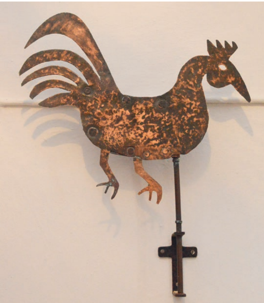
Lilla Beddinge kyrktupp