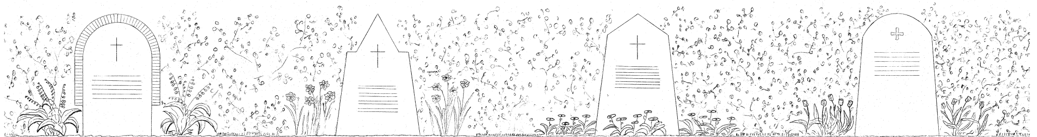
Typ 4, Stående vård höjd 80 cm, bredd 55 cm, max tjocklek 8 cm