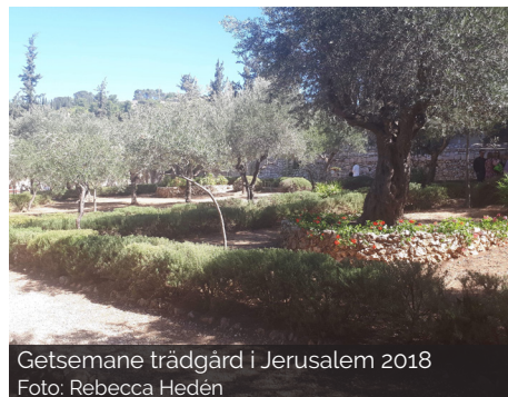
Getsemane trädgård i Jerusalem 2018

Jesus äter för sista gången tillsammans med sina tolv lärjungar och Jesus säger till dem att de ska fortsätta att bryta bröd och dricka vin tillsammans även när han inte finns ibland dem. Gör det till minne av mig, säger Jesus. Den här kvällen är förebilden för kyrkor i hela världen varje gång de firar nattvard med bröd och vin. Senare på natten, när Jesus och hans lärjungar har samlats i Getsemane trädgård, grips Jesus av de romerska soldaterna. Det är en av lärjungarna, Judas, som förråder Jesus. Han får 30 silvermynt för att avslöja vem Jesus är.