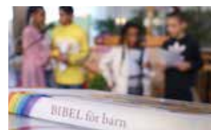
Barnkören Småstjärnorna övar.