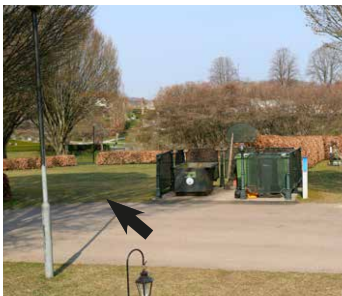
Kvarteret KD Fasanen.

För grekisk-ortodoxa bekännare hänvisas till samtliga platser på allmän begravningsplats.