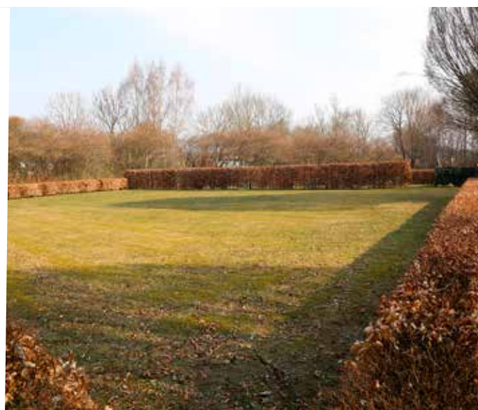
Kvarteret Ringduvan