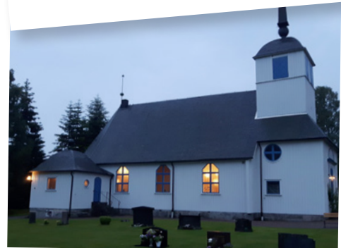
MIDSOMMAR 20 juni