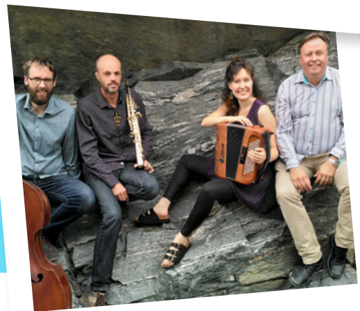
BLÅ DAGER 6 juli