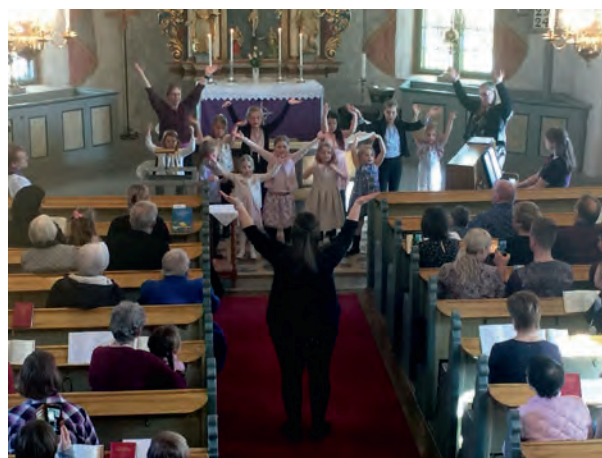
Familjegudstjänst i Magra kyrka 31 mars.