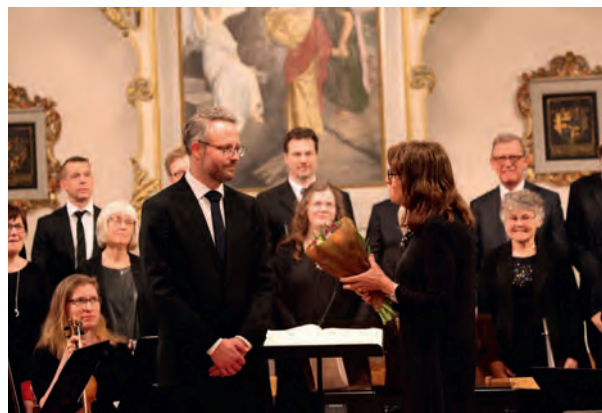
Musik i fastetid, Långareds kyrka 3 mars.