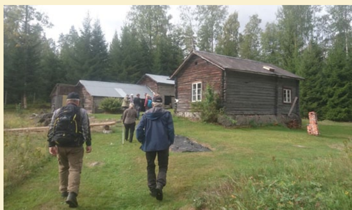
Fotot är från Kyrkvandringen 2018