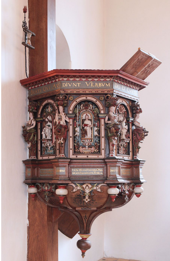
Predikstolen snidades i ek på 1600-talet.