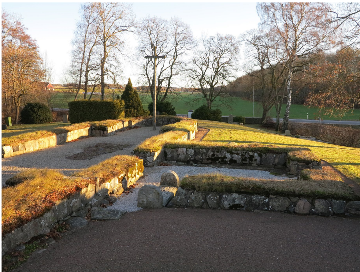
Grunden till Bosarps romanska kyrka på den gamla kyrkogården.

Kyrkogården är till största del gräsbevuxen och omges av höga träd som bok, björk och lönn. Här växer också städsegröna växter som buxbom, tuja och idegran. Den romanska kyrkogrunden höjer sig en halvmeter upp ur marken och visar tydligt hur den gamla kyrkan var planlagd. Grunden frilades och restaurerades 1949. Vid samma tidpunkt ordnades kyrkogårdens gamla gravhällar som sägs ha rörts om i samband med rivningen 1867. Flera av dem har daterats till romansk tid. Den kulturhistoriskt sett mest intressanta återfinns i vapenhusets västmur och Framställer Kristus som världsdomare. Under honom syns en figur med två nycklar som flankeras av två män med