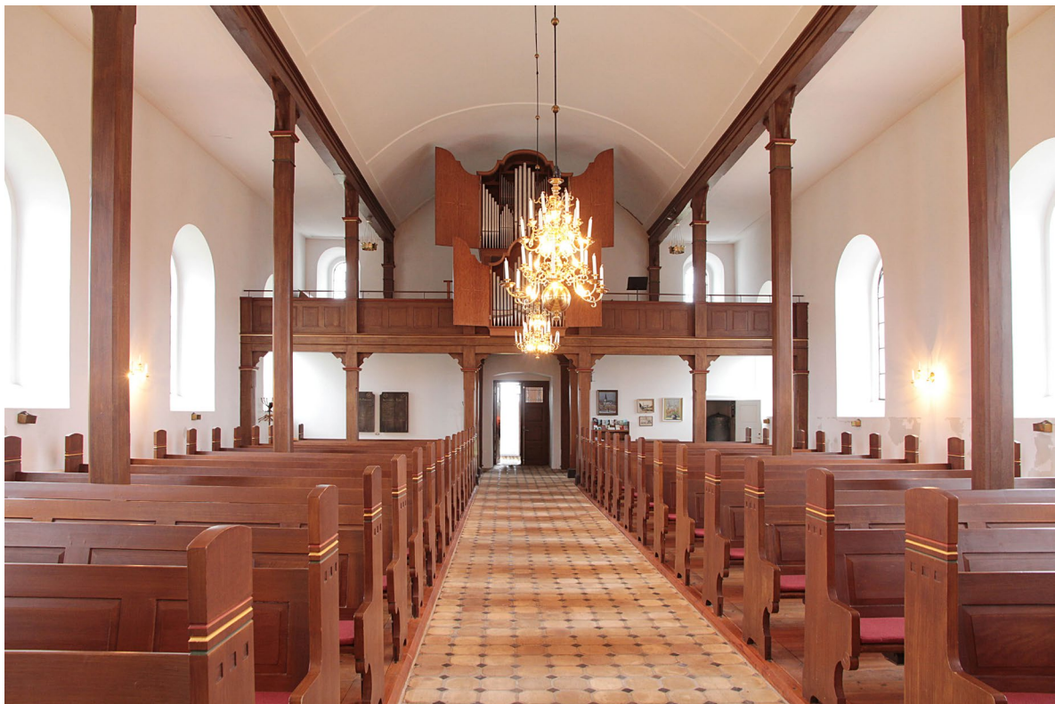
Kyrkorummet sett från öster.

I mittgångens ände står ett enkelt träaltare på en korsprydd matta. I det nordöstra hörnet står den medeltida dopfunten och ett dopaltare. Predikstolen är fäst i den östra pelaren mot väggen och nås från sakristian via en öppning i långhusets östmur. Två trappsteg i kalksten leder upp till koret som till största del upptas av den genombrutna altarringen. En marmorerad och förgylld rundbåge ramar in de två blyinfattade korfönstren mot öster. Glasmålningarna utfördes 1913 av konstnären Anders Nilsson