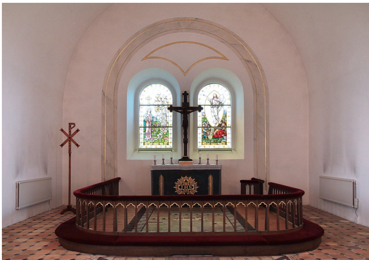
Koret i öster.

Dopfunten som är placerad i långhusets nordöstra hörn tros ha huggits omkring år 1200 av den så kallade Hylliegruppen, vars funtar karaktäriseras av runda cuppor med palmettbård och profilerad kubisk fot. Cuppans nedre del är dekorerad med repstavsornamentik. Sandstenssockeln tillverkas 1994 av stenhuggare Mats Johansson i Dalby.