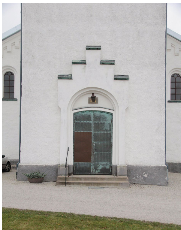
Västportalens omfattning kröns av en trappstegsgavel.

Kyrkans planform utgörs av västtorn, rektangulärt långhus samt något smalare och lägre rakslutat kor i öster med sidobyggnader för sakristia och förråd. Sannolikt vilar den på en kallmurad