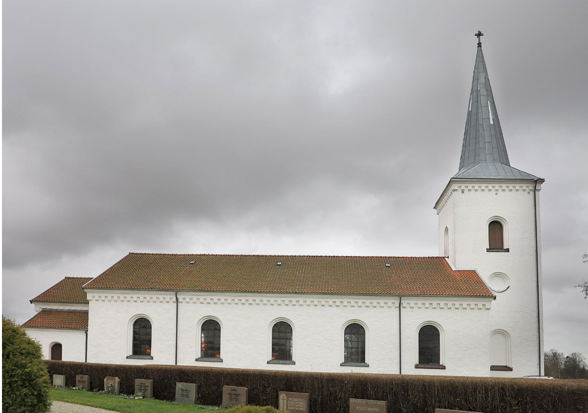
Kyrkan sedd från norr.

naturstensgrund. Socken är utförd i gråputsad kluven granit och gråsten. Murverken är uppförda dels med kluvna granitblock från uppförandetiden, dels med tuktad kalk-, sand- och gråsten som återanvänts från den medeltida kyrkan. Tornets övre parti är murat med maskinslaget tegel liksom muröppningarnas omfattningar och den dubbla tandsnittsfrisen som löper längs med långhusets, tornets och korets takfot. Kortillbyggnaderna är båda uppförda med handslaget tegel.