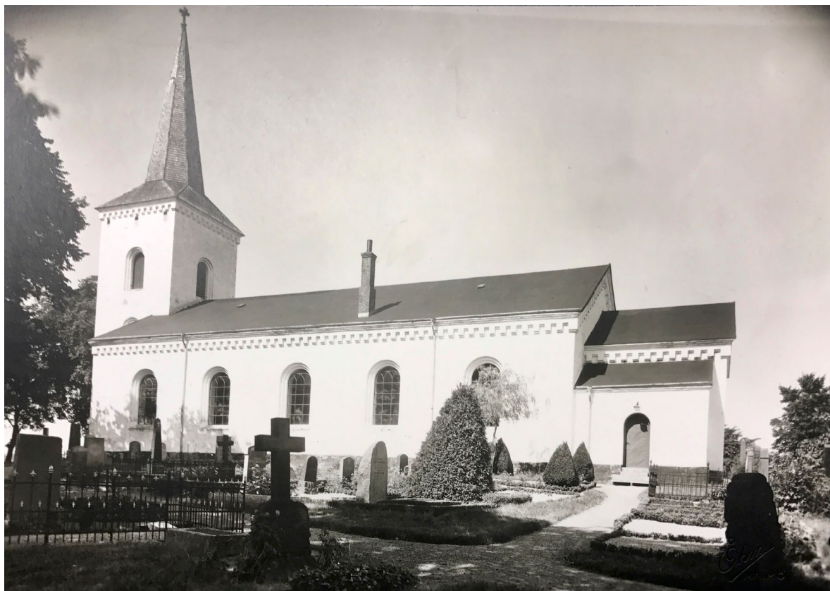
Bosarps kyrka fotograferad 1944. Spiran var ännu klädd med stickspån och långhusets och korets takfall med papp.

Vid byns södra del löper Bosarps jär, en så kallad ”getrygg”, bildad av inlandsisens smältvattenströmmar. Den ädellövskogsklädda rullstensåsen skyddas som naturreservat. På jären finns en kägelformig håla, ”Rövarehålan”, vilken enligt den lokala traditionen ska ha varit tillhåll för ett rövarband. Det sägs att en kopparkittel med en skatt finns nergrävd i hålan. Flera lär ha grävt efter skatten och någon enstaka till och med fått tag i kopparkitteln, men då tystnad måste råda under upptagandet och lycksökaren inte kunnat hålla mun har skatten återigen försvunnit. Varje långfredagsmorgon kan man enligt sägnen höra sång och musik i Rövarehålan.