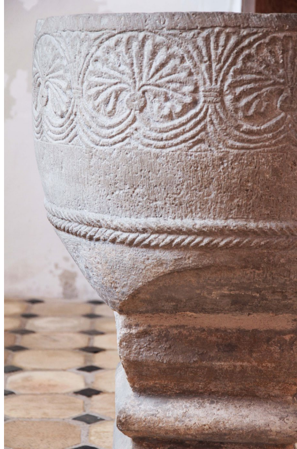
Den medeltida dopfunten tillskrivs den så kallade Hylliegruppen.

Orgeln i ädelträ byggdes 1952 av D.A. Flentrop och har 18 stämmor fördelade på tre manualer och pedal. Ryggpositivet bryter upp läktarbarriärens mitt. Orgelhuset och ryggpositivet flankeras av öppna luckor dekorerade med stjärnstrålar.