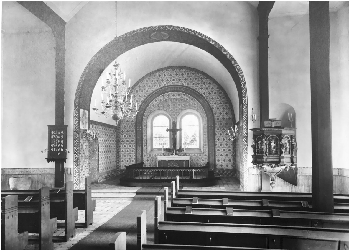
Koret och väggarnas nedre del dekorerades 1913 med målerier i nationalromantisk stil. Foto taget 1944.