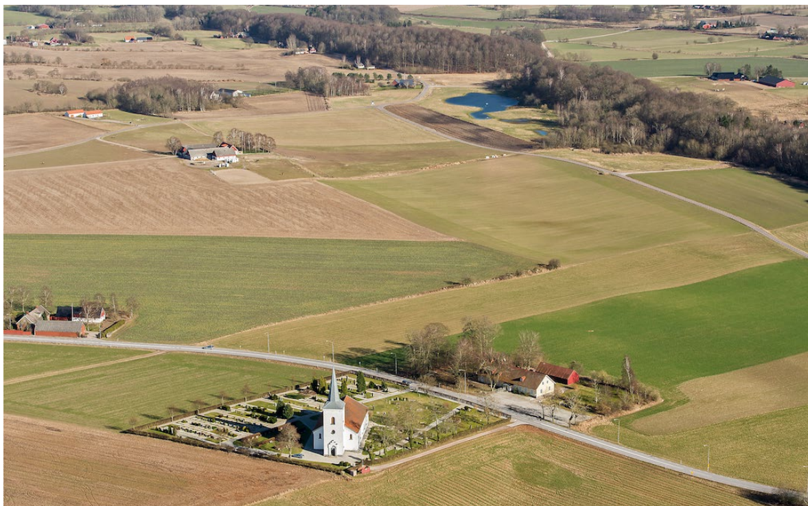
Flygbild över Bosarp tagen från väster. På andra sidan vägen ligger den gamla skolan och i bildens bortre del ser man rullstensåsen Bosarps jär som en grön kil genom landskapet. Foto: Pär-Martin Hedberg, 2014.

Gårdarna i Bosarp ägdes under medeltiden av domkyrkan, kyrkan och senare av adeln och kungen. Först under 1700-talet gavs bönderna i Bosarp möjlighet att köpa loss gårdarna de brukade.