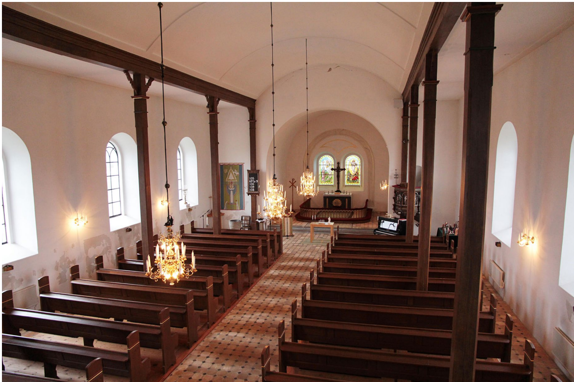
Kyrkan sedd från väster.

Det treskeppiga kyrkorummet har rektangulär planform med öppen bänkinredning på ömse sidor om mittgången. Tolv kvadratiska träpelare med bas och kapitäl bär upp