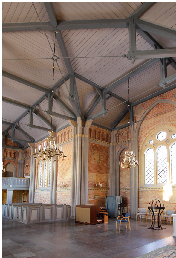
Norra korsarmen. Takstolarnas järnstag spänner genom kyrkorummet.

Korets kalkstensgolv ligger ett par trappsteg högre än det övriga kyrkorummet. Väggar har samma grundutformning som långhusets och korsarmarna men är aningen mer dekorerade. I hörnet mot den södra korsarmen står predikstolen och på motstående sida en bit av ett lågt genombrutet korskrank. Bakom skranket står kyrkans medeltida dopfont. Tidigare stod dopfonten i den norra korsarmen. Den nygotiska altaruppsat-