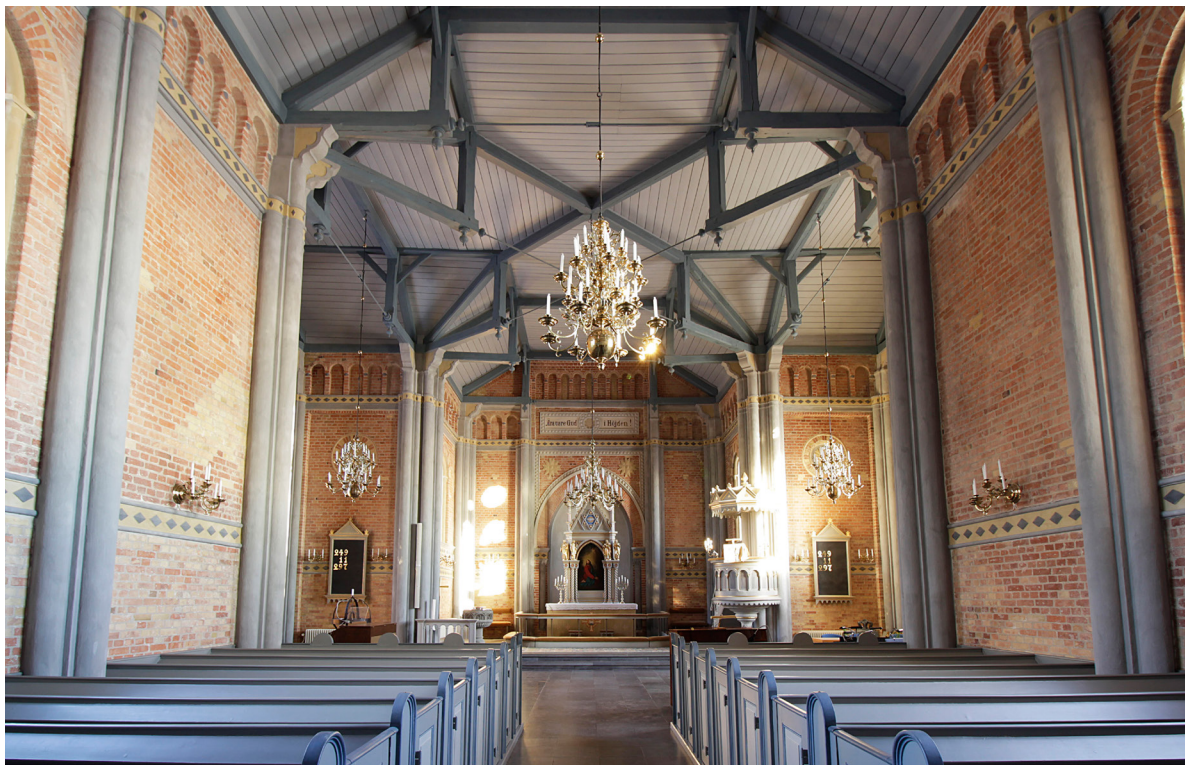
Kyrkorummet är rymligt och domineras av tredingstaket och de öppna romerska takstolarna. Foto taget från väster.

Kyrkans huvudentré återfinns i den västra gaveln. Den gråmålade pardörren har tre fyllningar i varje dörrblad och leder in till förhallen. Golvet är belagt med kvadratiska kalkstensplattor och de teglade väggarna är mönstermurade med pilastrar och en för-