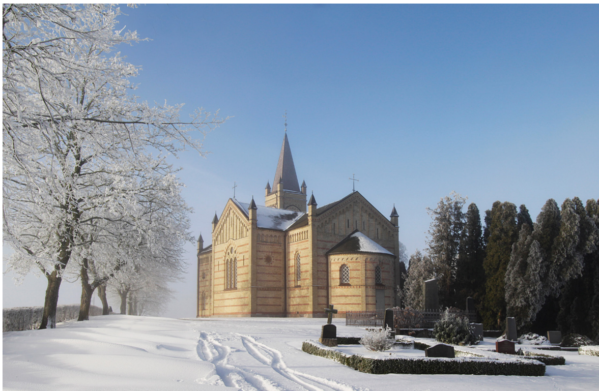
Borlunda kyrka ligger på en höjd i åkerlandskapet mellan Eslöv och Lund och omges av en parkliknande kyrkogård i engelsk stil.

2001 genomgick kyrkan en omfattande restaurering. Omkring 5000 murtegel byttes ut och skiffertaken lagades partiellt. Latexfärgen från 1967, som genom sin täthet hindrat fuktvandring i murarna vilket bidragit till de stora skadorna, togs bort. Hälften av bänkarna avlägsnades och en toalett och ett pentry installerades i anslutning till förhallen.