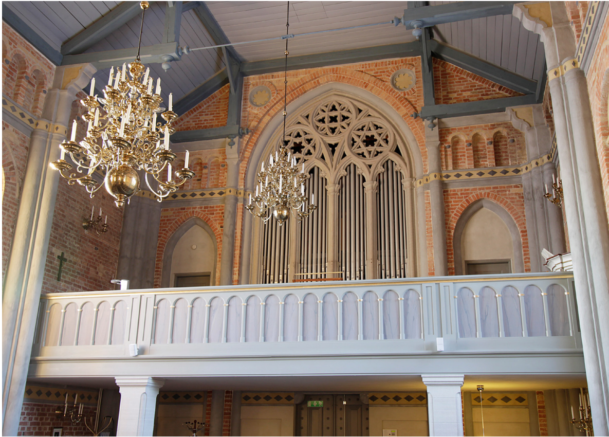
Orgelläktaren upptar hela långhusets västra sida.

sen och altaret är placerade i en spetsbågig blindering åt öster. Ovanför blinderingen är väggen dekorerad med två stjärnformiga putsornament samt en bård med texten Ära vare gud i höjden. Altaret döljer ingången till sakristian som finns inrymd i den halvrunda absiden åt öster. Rummets väggar är avdelade med en horisontell list med en bård av putsade romber. Det undre väggpartiet är gulmålat medan det övre är vitkalkat. En dörr åt öster leder ut mot kyrkogården. Ljuset kommer från relativt små korfönster åt söder och norr.