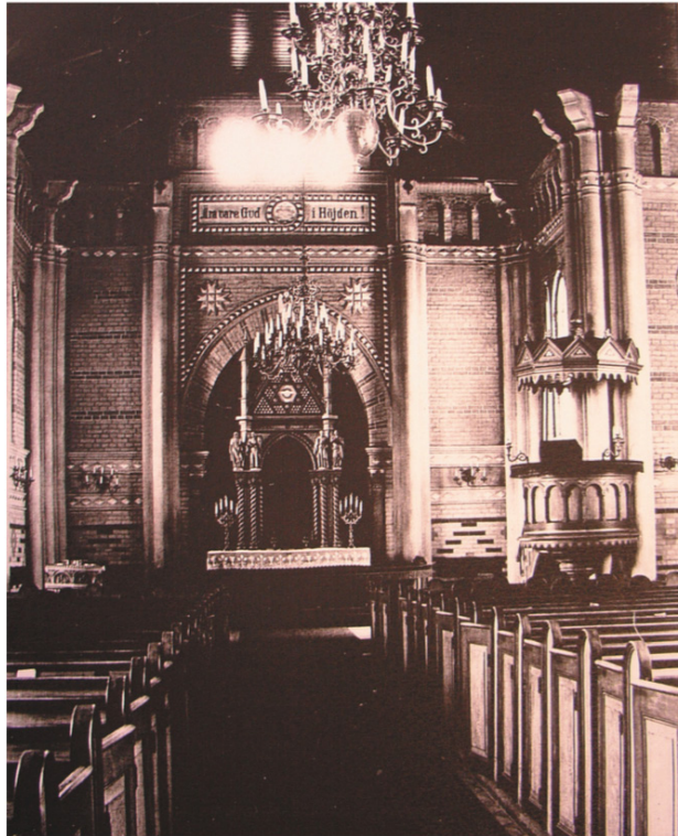
Kyrkorummet fotograferat av konstnären Bror Hjorth 1928.

1992 störtade ett av kyrkans prydnadstorn in genom taket och landade på orgelläktaren, och kyrkan fick stängas på grund av rasrisk. Takstolarna hade stora sprickor och flera bjälkar var rötskadade, därtill var ett stort antal tegel i behov av att bytas. Pastoratet ansökte 1994 om partiell rivning av kyrkan hos, i syfte att använda ruinen som friluftskyrka. Riksantikvarieämbetet avlog ansökan med hänvisning till dess unika kulturhistoriska värden. Pastoratet överklagade beslutet ända upp till kammarrätten när de slutligen fick nej. 1997 ansökte pastoratet om medel för att iståndsätta kyrkan.