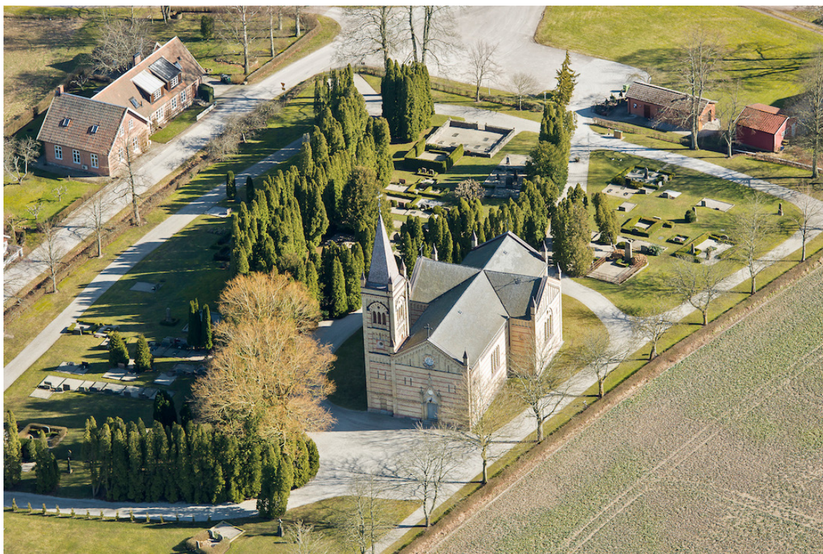
Flygbild över Borlunda kyrkogård tagen från väster, 2014.

Platsen för den gamla kyrkan finns markerad med en sten på andra sidan byvägen. Skeglinge gamla kyrkogård finns markerad med en gråstensmur kantad av höga lövträd utmed vägen till Eslöv. Även formen för den medeltida kyrkan som revs 1872 finns markerad i marken med gråsten. I kyrkogårdens nordöstra hörn står en klockstapel där kyrkans gamla 1400-talsklocka hänger. Borlunda församling firar årligen utomhusgudstjänst på platsen.