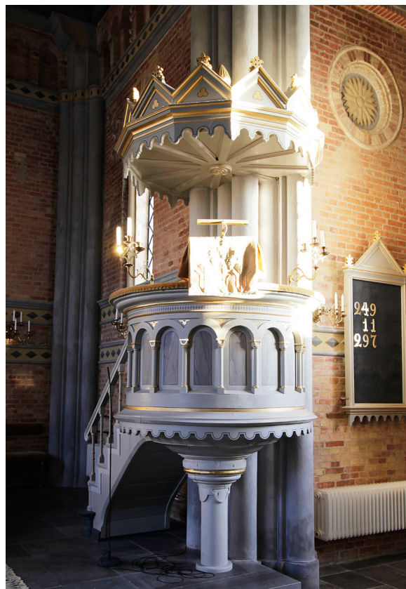
Predikstolen i korets sydvästra hörn.

Bänkinredningen är sluten och har uppstickande rundbågiga gavelstycken mellan de fyllningsförsedda dörrarna. Bänkarna var liksom den övriga inredning ursprungligen ekådringsmålade i två nyanser.