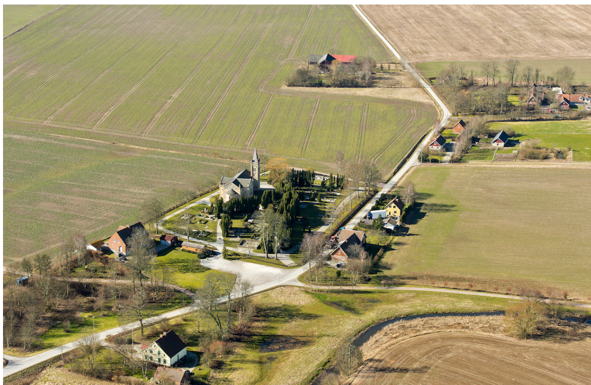
Flygbild över Borlunda tagen från öster, 2014.

I området finns flera registrerade lösfynd samt stenåldersboplatser och bronsåldershögar. Fynden tyder på att borlundatrakten varit bebodd under lång tid. Första gången orten omnämns var på 1100-talet, ortsnamnet skrevs då Borlundom. Förledet Bor tros