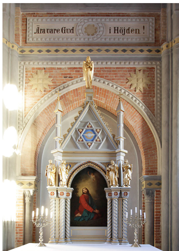
Altaranordningen döljer ingången till sakristian.