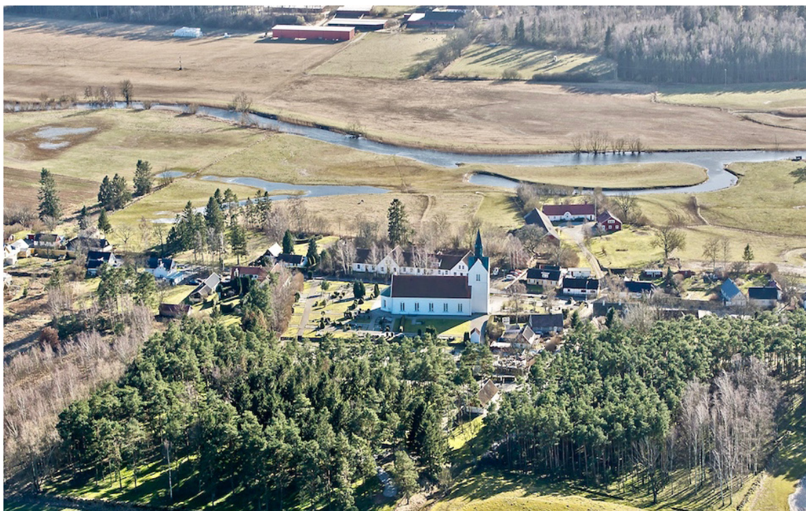
Flygbild över Holmby kyrka 2014, tagen från norr. Söder om kyrkan rinner Kävlingeån.

På 1100-talet uppfördes på platsen för dagens kyrka en romansk stenkyrka. Den medeltida kyrkbyn var placerad sydväst om kyrkan, på en strategisk plats något närmare Kävlingeån än den nuvarande tätorten som idag består av utskiftade gårdar och ett antal gatehus utmed byvägen.