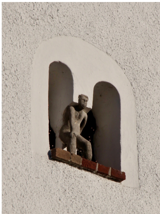
Mansfiguren som utgör mittpost i tornets dubbla rundbåge brukar tolkas som jätten Finn.

Den femsidiga absiden har två rundbågiga fönsteröppningar i nordost och sydost. Utformningen är enklare än långhusets fönster, med en båge med diagonalställda spröjs. Rakt i öster finns en entré med samma typ av dörrblad som i väst- och sydporten men här utan överljus.