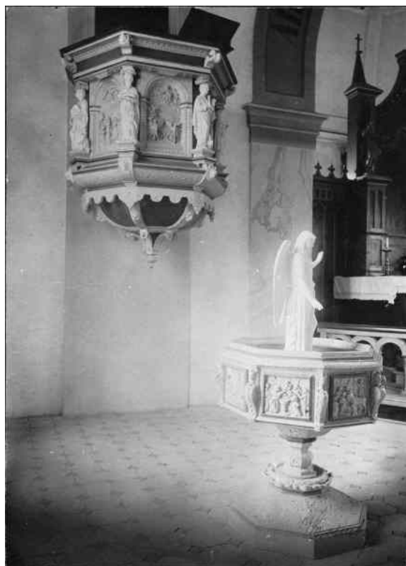
Predikstolen var innan 1939 placerad norr om koret. I bakgrunden skymtar det tidigare korskranket. Bilden hämtad från RAA:s Kulturmiljöbild. Foto: T. Wählin, sannolikt tidigt 1900-tal.

1939 genomfördes en större restaurering under ledning av arkitekt Eiler Græbe. Långhusets med svarta cementplattor byttes ut mot rött