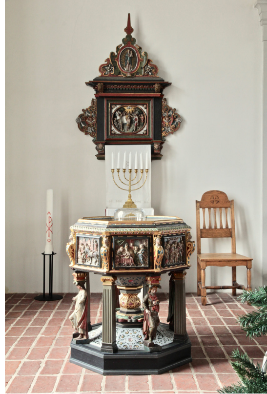
Högklassigt träsnideri i dopfunten och handdukhängare från 1600-talet.