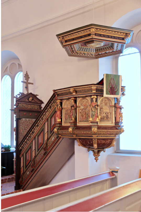
Predikstolen är sedan restaureringen 1939 placerad invid kyrkorummets södra vägg.