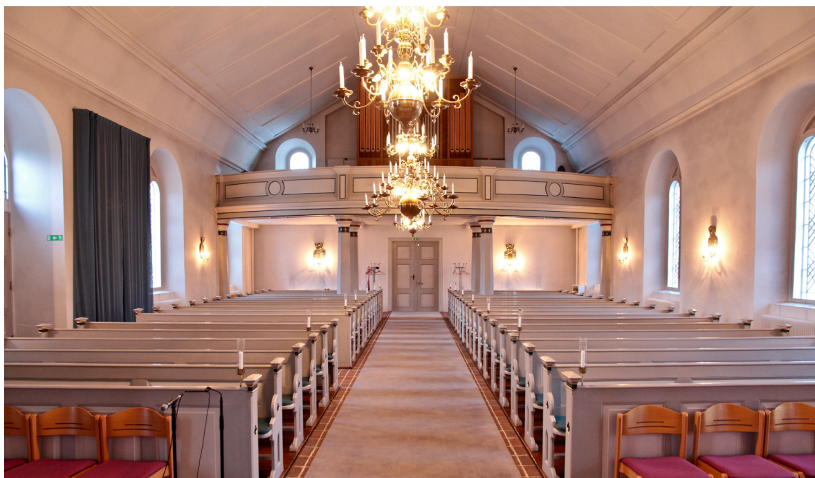
Orgelläktaren i långhusets västra del.

Kyrkorummets östra del fungerar som kor och är upphöjt två trappsteg i förhållande till långhuset. I östra väggen finns en stor rundbågig och meterdjup nisch som rymmer altarpuppans. Den gråmålade omfattningen består av pilastrar som bär upp en profilerad rundbåge. I östra väggen söder om altaret leder en dörr in till den bakomliggande sakristian som inryms i kyrkans polygonala absid. Här är golvet täckt av en röd melerad plastmatta och väggarna putsade och målade likt kyrkorummet. Taket är putsat och fältindelade. Rakt i öster finns en pardörr med tre fyllningar i vardera dörrblad, målad i två grå kulörer. Mellan pardörren och östporten, vars insida är utformad likt pardörren, finns ett vindfång. Sakristian är möblerad med skrivbord och förvaringsmöbler. Mot västväggen finns ett enkelt bönealtare med knäfall.