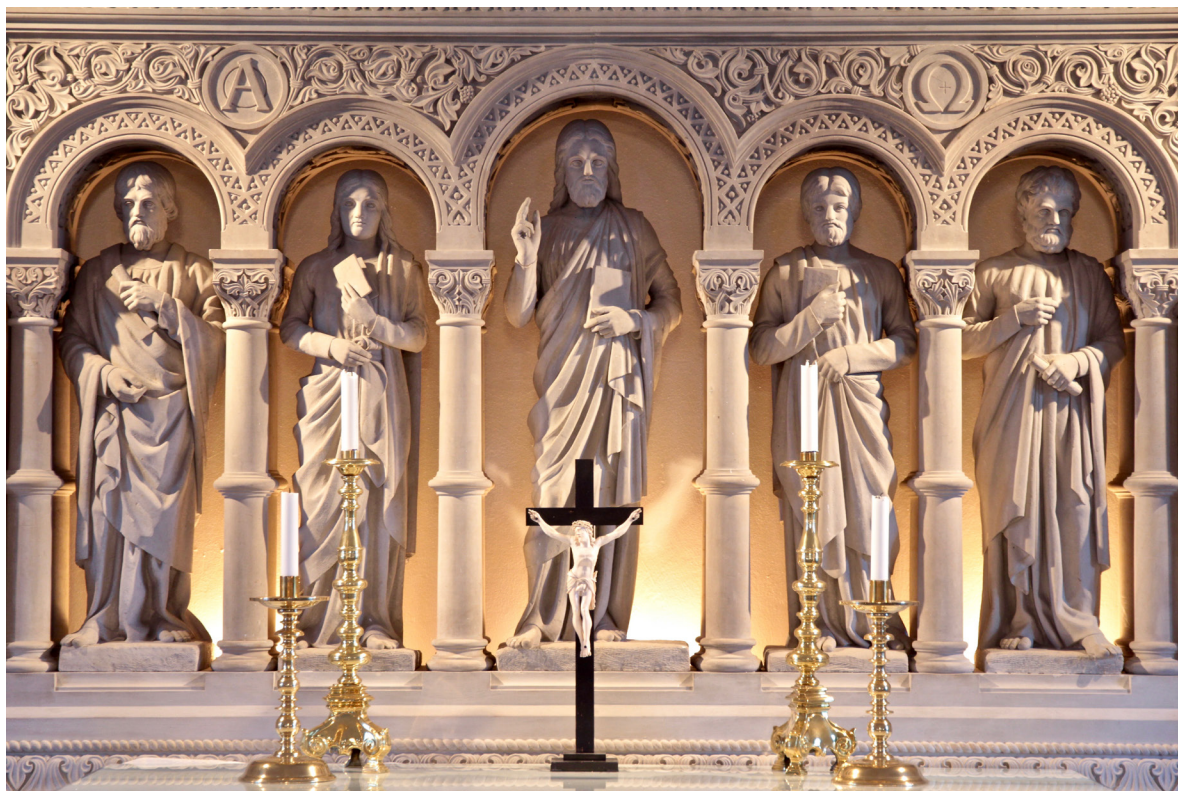
Utsnitt av altaruppsatsen som ursprungligen tillverkades för Lunds domkyrka.