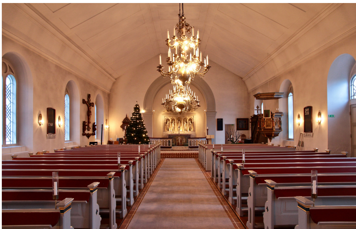
Kyrkorummet sett mot koret i öster.

På tornets andra våningsplan som nås från trappan i vapenhuset har ett inre tornrum skapats genom uppsättning av gråmålade väggar i väster och söder. Väggarna är utformade som ramverk i trä och har troligen utgjort sidorna i ett tidigare orgelhus. Här finns även delar av kyrkans nygotiska orgelfasad från 1873 bevarad och upphängd. I öster finns en dörr till orgelläktaren, medan en dörr i västväggen leder ut till det L-formade rum som utgör resten av tornvåningen. I de vitputsade murverken syns vapenhusets fönster och överljus sticka upp genom det brädade golvet. Två ekbjälkar i öst-västlig respektive nord-sydlig riktning löper genom rummet i huvudhöjd. I väster leder en trätrappa vidare upp i tornet. På plan tre finns medeltida kvaderristningar i väggarnas puts. Högt upp i den östra väggen leder en lucka in till kyrkvinden. Via en trappa i öster nås kockvåningen på plan fyra som är öppen upp i takspirans nock. Vid gavelrösten övergår murverken från natursten till tegel. I de östra och västra gavel-