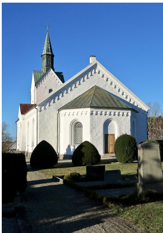
Kyrkan sedd från öster.