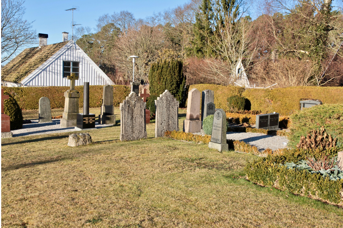
Den äldre delen av kyrkogården, närmast kyrkan, präglas av högresta gravstenar typiska för decennierna kring sekelskiftet 1900.

och omgärdas av huggna stempelare och järnstaket. Flertalet gravar inramas dock av lågt klippt buxbom eller huggna stenramar. I norr, mot nya kyrkogården, är gravvårdarna i allmänhet lägre i skala. Växtligheten är varierad med formklippta städsegröna buskar, barrträd som en och idegran, men även lövträd som järnek, glanskörsbär och björk. Strax norr om kyrkan i höjd med koret anlades 2014 en urngravlund.