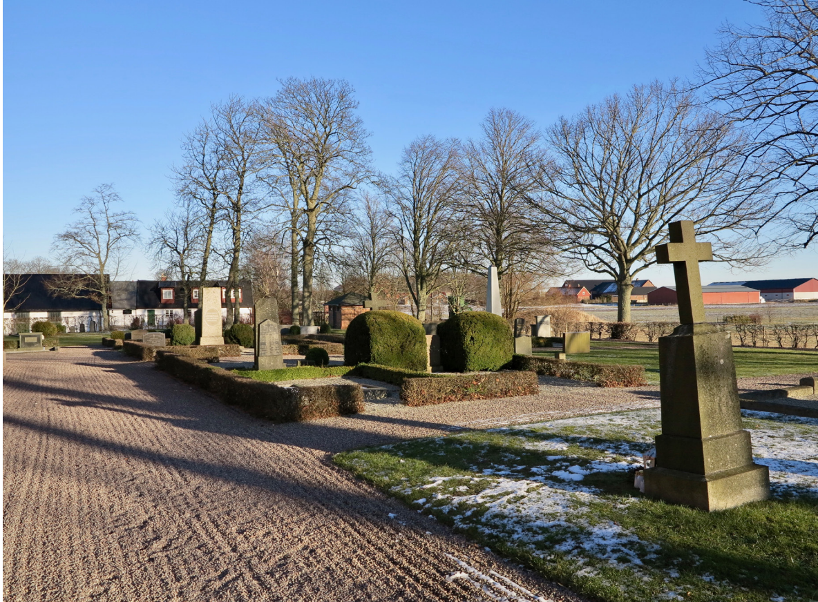
Remmarlövs kyrkogård präglas än idag av den rutnätsformiga planen från tiden för kyrkans uppförande.