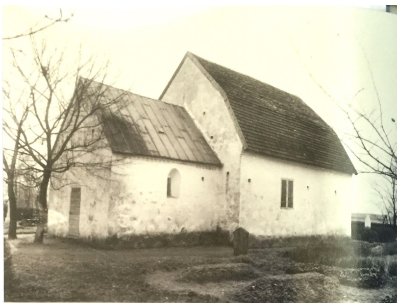
Remmarlövs gamla kyrka fotograferad strax innan rivningen på 1890-talet. Fotografokänd.

Remmarlövs medeltida kyrka uppfördes troligen under sent 1100- eller tidigt 1200-tal i romansk stil, med endast långhus och kor. Kyrkan behöll genom århundradena i största utsträckning sin enkla ursprungsutformning, med undantag för ett senare adderat vapenhus i söder. Något torn blev aldrig uppfört, istället fanns en klockstapel nordväst om kyrkan. Efter de dansk-svenska krigen på 1600-talet var kyrkan mycket medfaren, närmast en ruin, men vid mitten av 1700-talet hade den åter iståndsatts. Den ökade befolkningmängden under 1800-talet ledde på många håll i landet, inte minst i Skåne, till att små medeltida kyrkor kraftigt byggdes om eller revs till förmån för nyuppförda kyrkor. Remmarlövs församling ställdes inför samma problem, och det