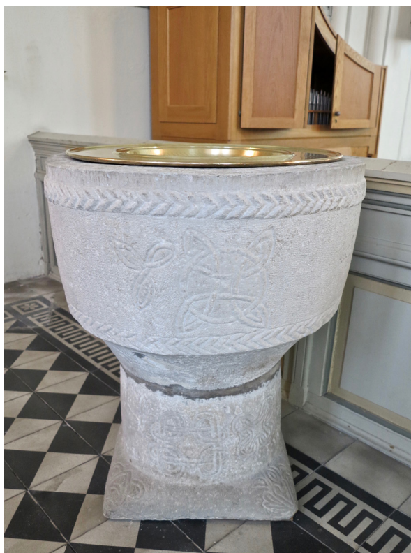
Dopfunten är placerad i korets sydvästra hörn.