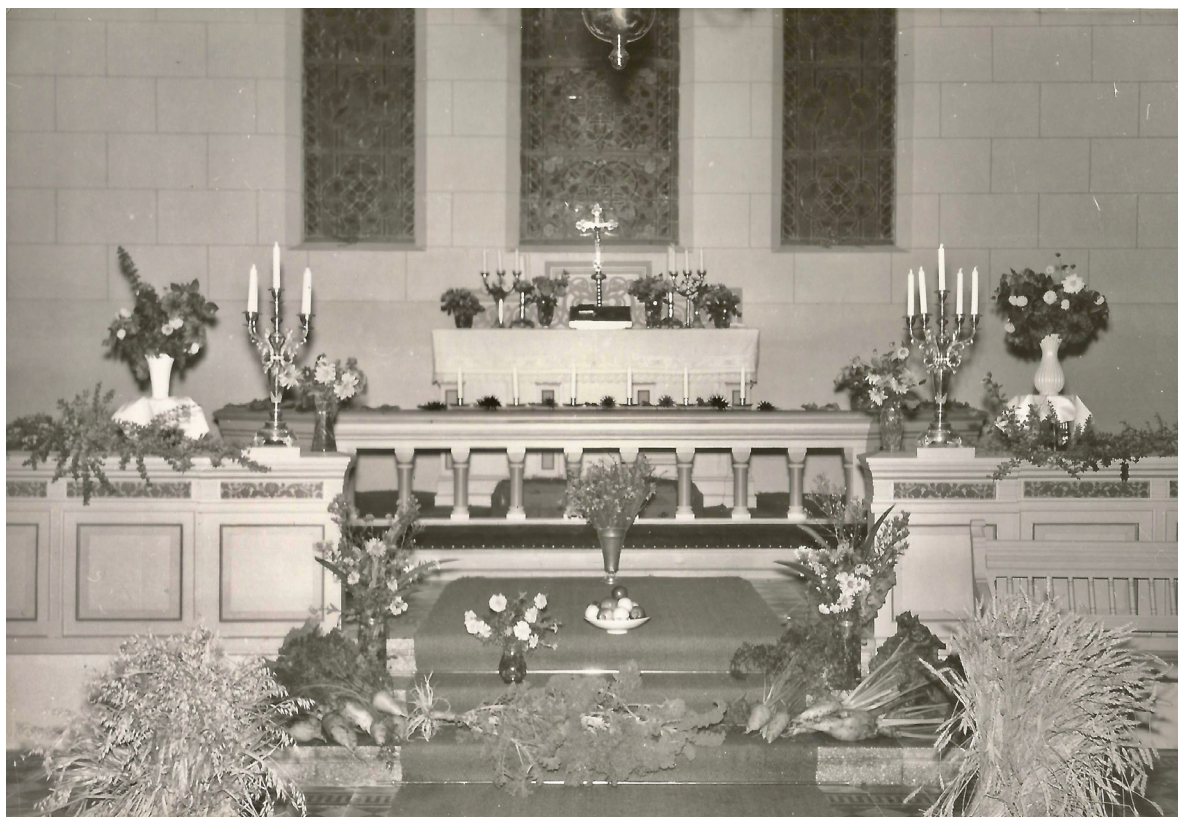
Ett fotografi från tacksägelsedagen 1955 visar att den ursprungligt polykroma kvadermålningen fått en enhetlig kulör. Möjligen skedde detta vid en restaurering 1952.

Orgelläktaren som upptar södra korsarmen och endast kan nås från utsidan har stått obrukad med den gamla orgeln bevarad sedan 1976, då en fyrstämig orgel installerades under läktaren i själva kyrkorummet. Ett förslag där läktaren skulle omvandlas till personalutrymmen upprättades 1980 men kom aldrig att realiseras.