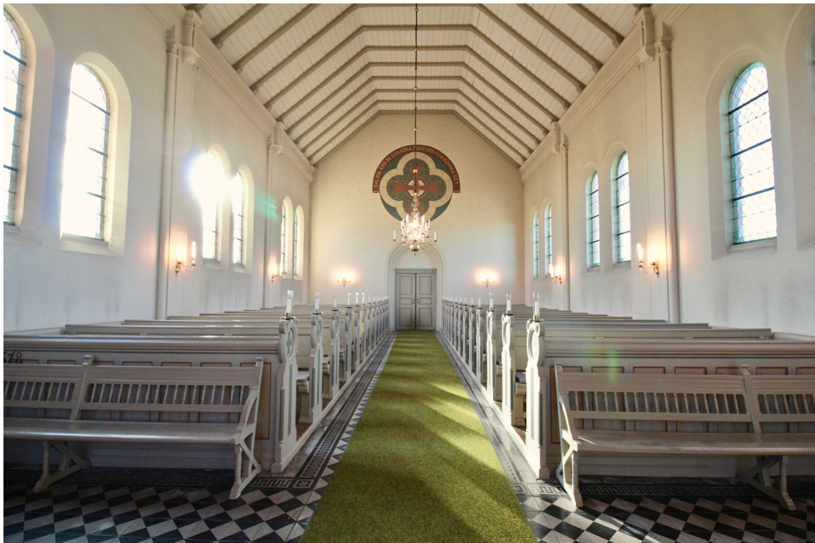
Långhuset sett från koret. Den polykroma ljusa färgsättningen tillkom 1971.

Genom kyrkans huvudentré i väster nås vapenhuset i tornets bottenplan. Golvet är belagt med svarta och vita viktoria-plattor med kringliggande meanderbård. De slätputsade väggarna är bemålade i en bruten vit kulör. Taket är målat i en ljusgrå kulör och består av spontad panel bakom synliga, profilerade takbjälkar. Kyrkportarnas insida är målade med grå linoljefärg medan de vardera fyra speglarna accentueras av målerier i gult och grönt. Pardörrarna som leder till kyrkorummet har liknande färgsättning men endast tre speglar vardera.