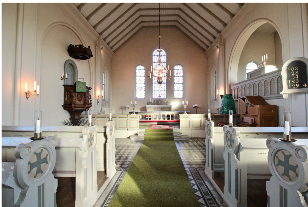
Koret i öster och orgelläktaren i den södra korsarmen.

Koret är en förlängning av långhuset, med samma utförande i golv, väggar och tak, och nås via tre trappsteg i cementmosaik. Nivåskillnaden i förhållande till långhuset förstärks av en nyklassicistiskt utformad barriär i grå kulör. Koret domineras av de tre korfönstren vars glasmålningar framställer Kristus och de fyra evangelisterna. Den södra korsarmen upptas i sin helhet av orgelläktaren som avskiljs från det övriga kyrkorummet genom en barriär med arkadmotiv och dekorativa målerier i form av lyror och blomstermotiv. Läktarens golvnivå är cirka 1,5 meter högre än korets, i våg med fönstrens underkant och den tidigare kvadermålningens bröstningshöjd.