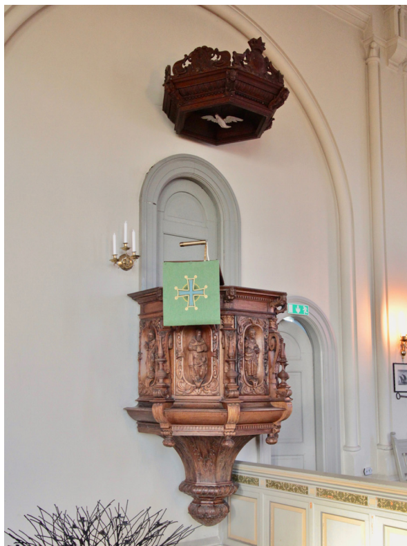
Predikstolen från 1753 med baldakin tillverkad under 1600-talet.

Den tidigmedeltida dopfunten av sandsten överflyttades även den från Remmarlövs gamla kyrka. Den runda cuppan är dekorerad med repstavsbander i över- och underkant samt knutor-