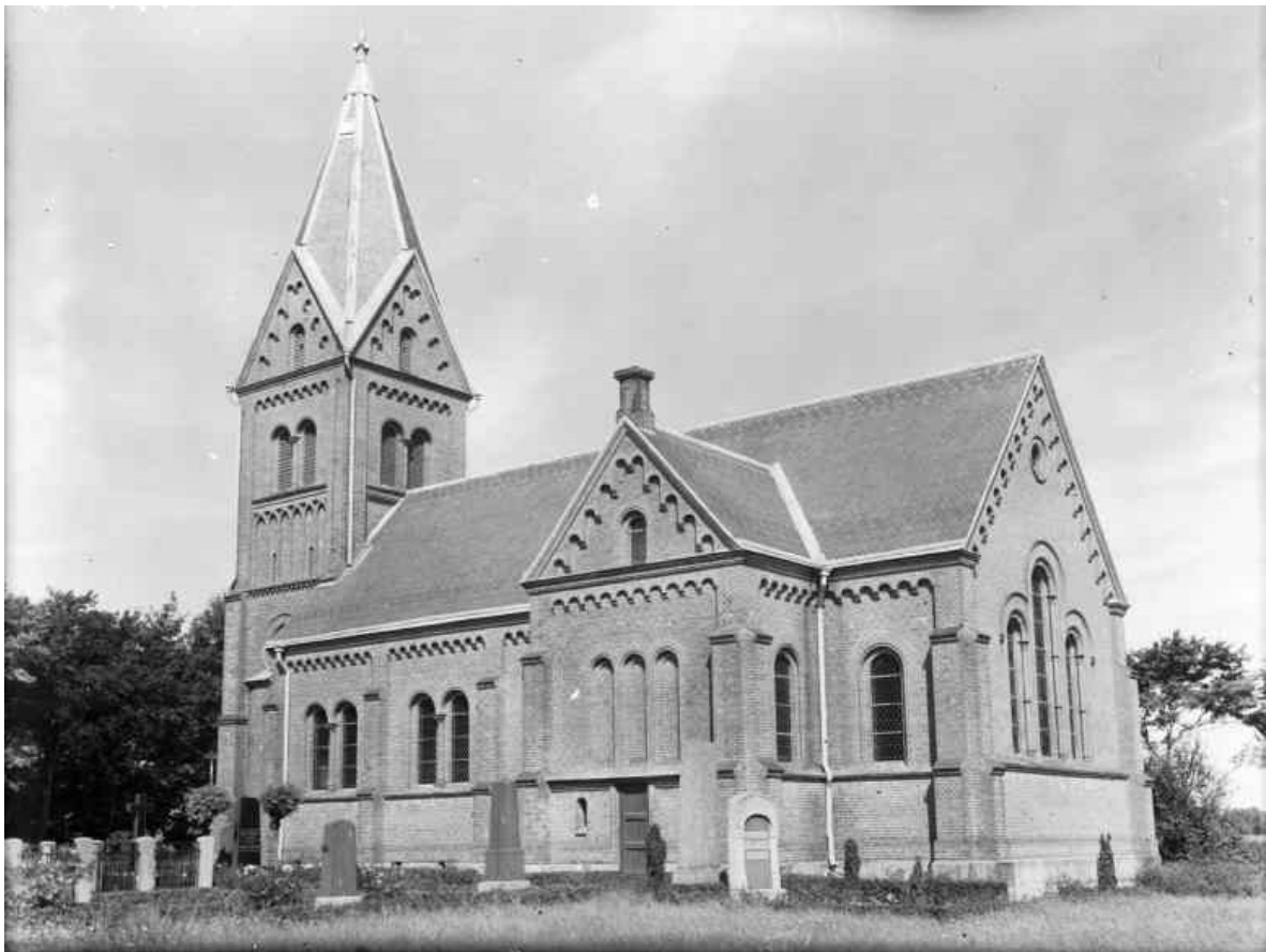
Remmarlövs kyrka 1929.