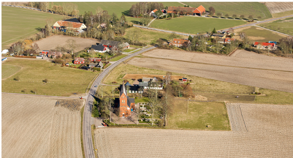
Flygbild över Remmarlöv 2014, tagen från väster.

Enligt 1569 års landebog var antalet gårdar i socknen 15, en storlek på byn som sedan dess varit närmast konstant. Under det tidiga 1700-talet vittnar beskrivningarna till den äldsta kända kartan över byn om hur befolkningen ännu lider svårt efter 1600-talets dansk-svenska krig. Flera gårdar står öde och under våta år tvingas bönderna köpa spannmål till föda. I och med skiftena under 1700-talets andra hälft ökar välståndet.