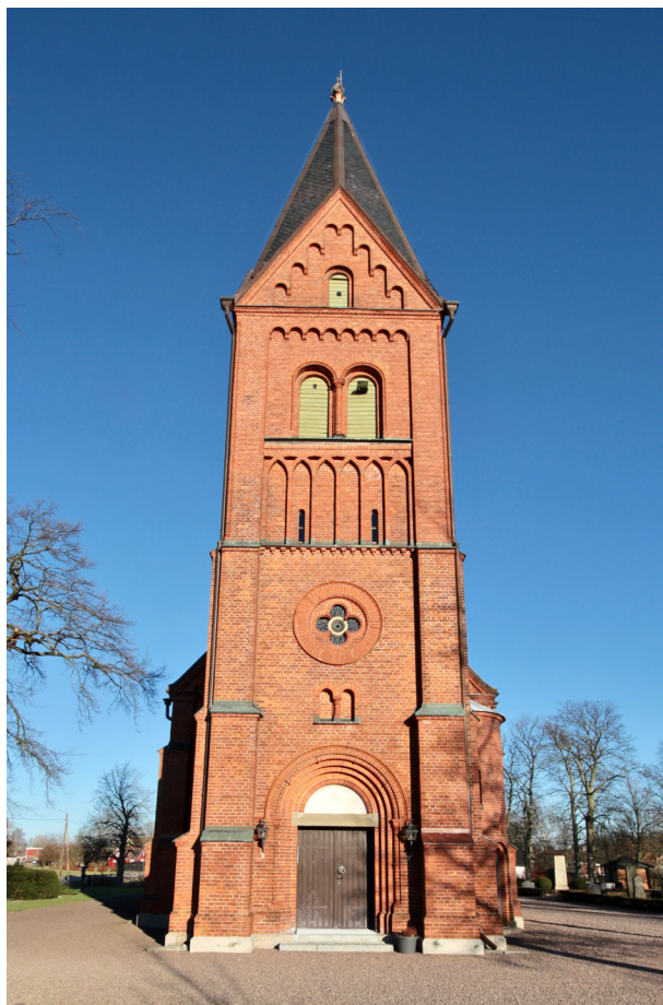
Tornet sett från väster.

Tornets nedre våning domineras av en romansk perspektivportal i tegel med ovanliggande tympanon. Kyrkporten utgörs av en brunfernissad pardörr med stående panel och kraftiga dekorativa smidesbeslag. I nord- och sydfasaderna återfinns vardera ett rundbågigt fönster och i knutarna står dekorativa strävpelare. Andra våningen har rundfönster med fyrpassformade ljusinsläpp i tre väderstreck. I västfasaden återfinns även en mindre kopplad rundbågeblindering. Klockvåningen pryds av lansettblinderingar under rundbågiga, kopplade ljudöppningar med ljudluckor i grönmålat trä. Tornet avslutas med fyra spetsgavlar med rundbågefris under den oktagonala tornspiran, vilken pryds av ett krönkorset i kopparplåt. Krönkorset tillkom i samband med takbytet 2001 och är en kopia av det ursprungliga krönkorset i zinkplåt som finns bevarat på tornvinden. På tornets södra sida, i mötet med långhuset, återfinns en halvrund torntrappa med rundbågigt port och ett mindre rundbågigt fönster.