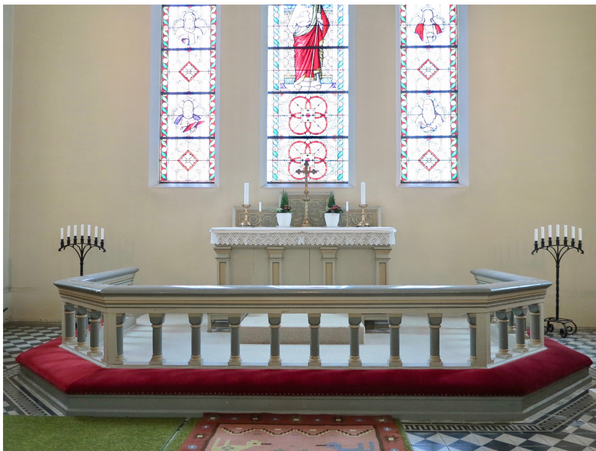
Altare och altarring i nyklassicistisk stil.

Den femsidiga altarringen är precis som altaret från kyrkans byggnadstid och utförd i trä i nyklassicistisk stil. De svarvade balusterdockorna är utförda som pelare med