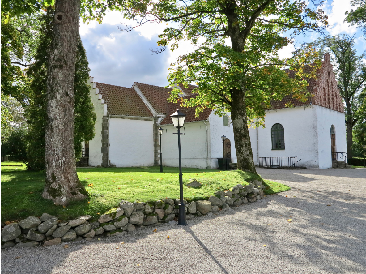
Norr om långhuset och koret ansluter nykyrkan och det Coyetska gravkoret.

re rundbågig nisch. Ljudluckorna består av enkla brädkonstruktioner, i vissa fall med smidesbeslag. Tornhuvens väggar är klädda med locklistpanel som troligen varit tjärad. Tornet/vapenhuset har inga fönster.