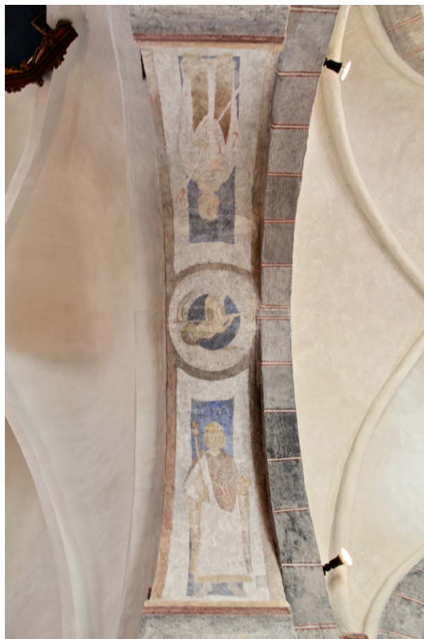
Kalkmålningarna på triumfbågens undersida.

framställs bland annat en kung och en biskop, vilka tolkats som Knut VI och ärkebiskop Absalon, eller hans efterträdare Anders Sunesen. På triumfväggen syns bland annat Maria med barnet, Johannes Döparen och Utdrivningen ur paradiset. Målningarna i koret skildrar tre män tillbedjandes en figur på en kolonn och har tolkats som S:t Dionysiuslegenden. I den norra väggen finns även en delvis rekonstruerad romansk fönsteröppning som togs fram vid restaureringen 1911 och dag fungerar som nisch. I väggen markerar ritsningar i putsen den tidigare dörröppningen till gravkoret. Innerbågen i fönstret i söder är försedd med blyinfattade glasmålningar.