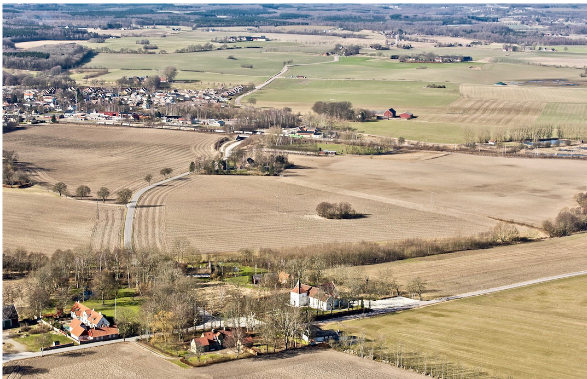
Flygbild över Stehags kyrkby 2015, med stationssamhället i bakgrunden.

Stehag nämns för första gången i skrift 1349, då som Stoodhaugæ . Namnet lär ha betydelsen stohagen. På storskifteskartan från 1798 har kyrkbyn 16 gårdar. Idag ligger endast ett fåtal gårdar kvar, däribland prästgården och klockarebostället med trelängad