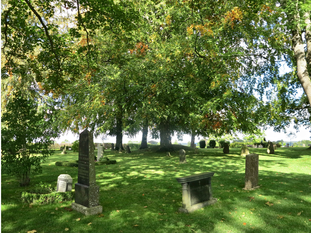
Stehags nya kyrkogård har parkkaraktär med gräsbevuxna ytor och riklig växtlighet.

gräsbevuxna med äldre sporadiskt utplacerade äldre stenar. Kyrkogården har ingångar i väster, sydöst och öster och inramas i sin helhet av en lönnhäck med inslag av bland annat liguster. Sedan 2013 eller 2014 finns även ett gunnebostängsel som skydd mot rådjur.