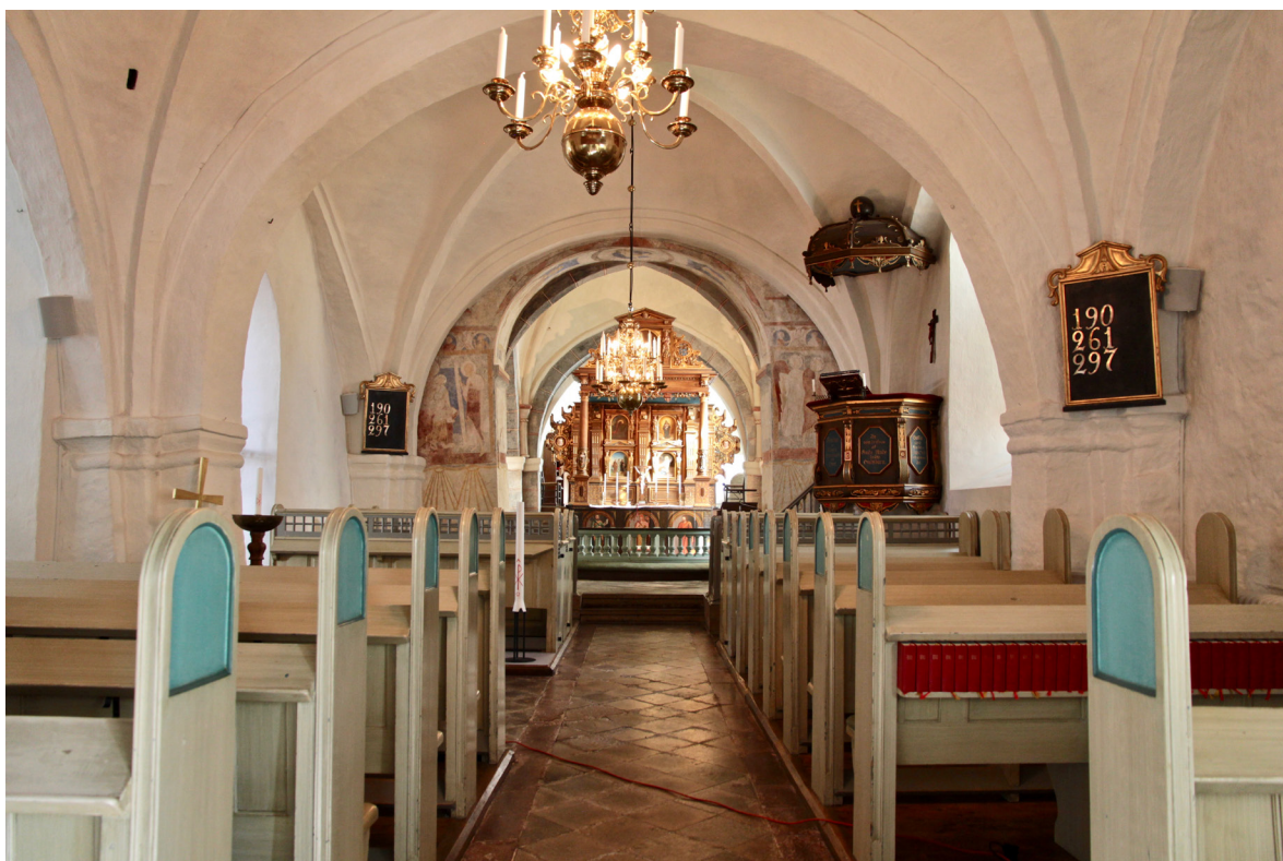
Långhuset mot koret i öster.

portalens omfattning av slåthuggna sandstenskvadrar. Även vissa delar av sydportalens omfattning är oputsade. Mot nykyrkan öppnar långhuset upp sig i två rundbågiga öppningar av vilka den östra är försedd med tre trappsteg i kalksten. Fönstrens innerbågar i trä är liksom i resten av kyrkan gråmålade. Sydväggens östra fönster är försett med blyinfattade glasmålningar. Långhuset är slaget med ribbvalv. Sköldbågarna är liksom den västra gördelbågen spetsbågiga medan den mittersta är svagt spetsbågig och den östra rundbågig. Den västra travéen upptas i sin helhet av orgelläktaren där 14 kannelerade pelare med profilerade baser och kapitäl bär upp fackindelade bjälkar. Pelare och bjälkar är gråmålade medan taket i läktarens undersida är utfört i vitmålad lockpanel. Barriären utgörs av stående ekpanel som bryts upp av orgelns framskjutande och tredelade ryggpositiv med synliga pipor. Det bakre utrymmet längst i väster avskiljs genom skärmväggar med ramverk laserade i grågrönt och speglar i blått. Bakom skärmväggarna ryms kapprum, elskåp och den gråmålade svängda läktartrappan. Pardörrarna mot västportalens vindfång är gråmålade och har fem fyllningar vardera.