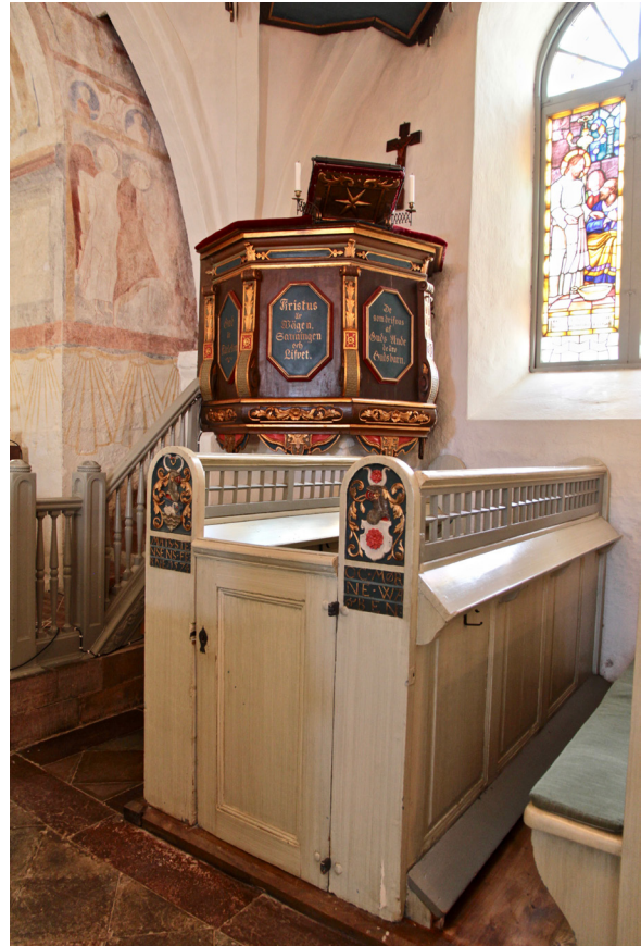
Herrskapsbänkarna från 1574. I bakgrunden ses predikstolen och de romanska kalkmålningarna på triumfväggen.