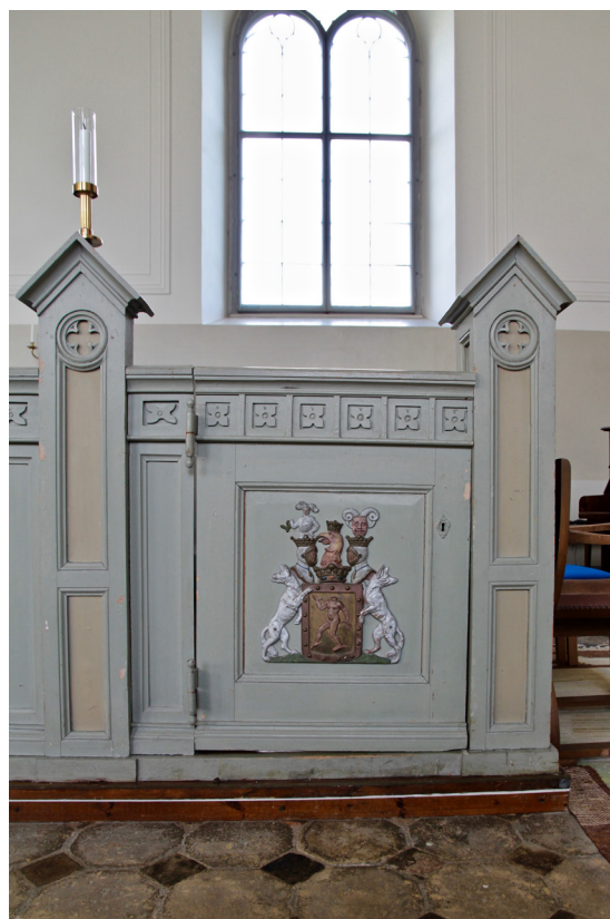
Herrskapsbänkarnas gavlar pryds av släkten Trolles vapen.

På ömse sidor triumfbågen hänger två nummertavlor i trä, enkelt utformade med gavelfält upptill och kontursågade understycken. Ramverken är målade i ljust grå kulör medan tavlan är målad i blått.