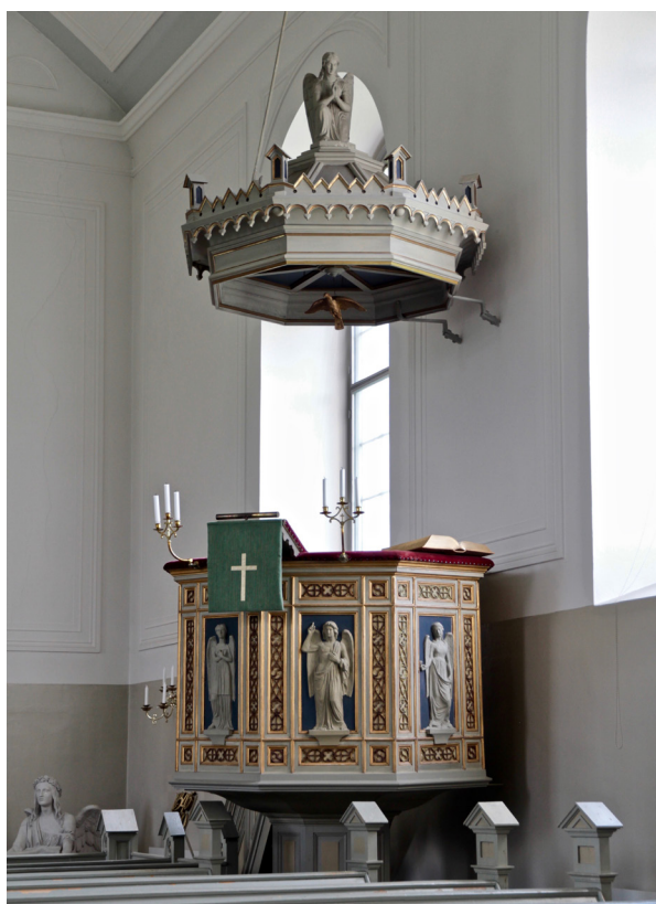
Predikstolen är placerad i långhusets sydöstra hörn.

I långhusets nordöstra hörn står en kopia av Thorvaldsens Dåbens engel, Dopänglen , utförd i sten- eller lergods och målad i bruten vit kulör. Motivet är en knäböjande ängel som håller fram ett snäckskal för dopvattnet. Skulpturen är placerad på en enkel sockel av gråmålat trä. Originalen från 1823 finns i Vor Frue kirke i Köpenhamn.