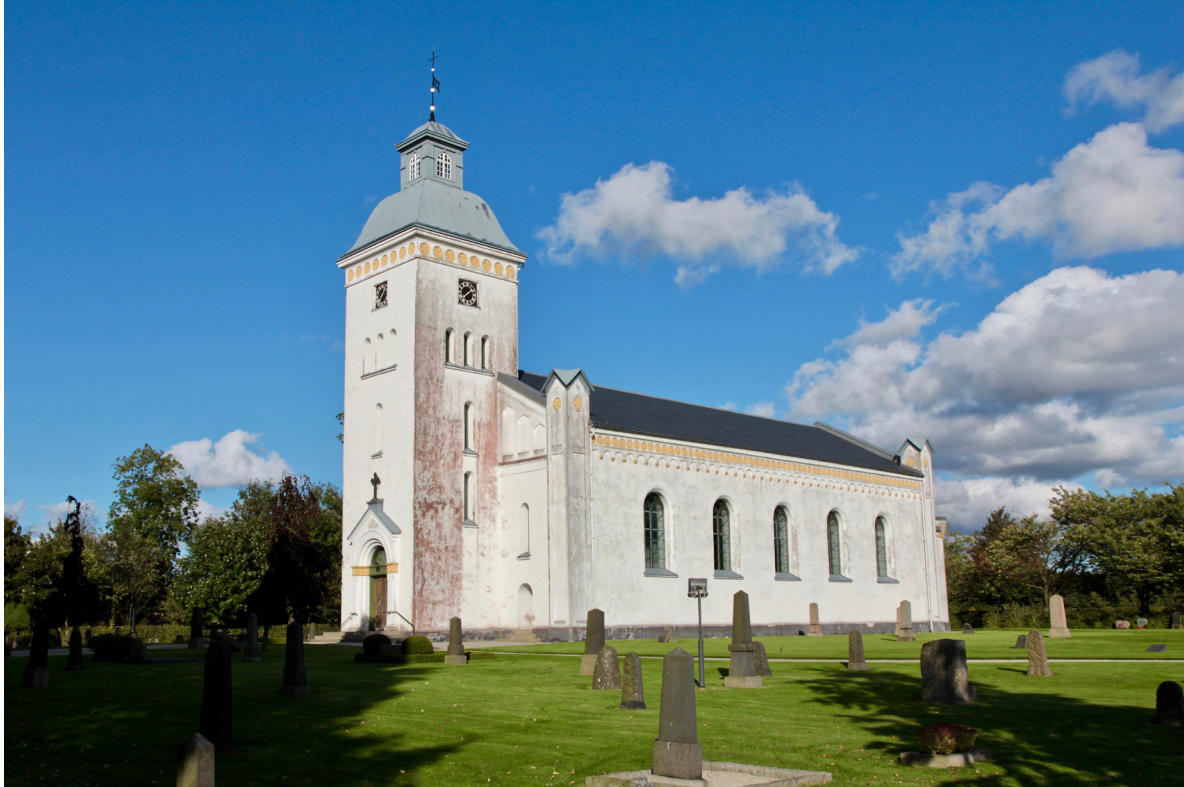
Kyrkan sedd från sydväst.

Västantren utgörs av ett slätputsat utskjutande gavelparti med rundbågig öppning indragen i tre steg. Bågarna vilar på pilastrar med kapital målade i gul kulör och över öppningen finns ett fält med den förgyllda texten UPPFÖRD UNDER KONUNG CARL XV:S REGERING AF FRIHERREN NILS TROLLE ÅR 1860. Ovan den plåtavtäckta taklisten kröns entrén med ett klöverkors i metall. Dörrpartiet utgörs av ett klassicistiskt uppbyggt ramverk med lunettformat överljus smyckat med fyrpass i rundlar, allt målat i grönt. Pardörrens dörrblad av lackad ek har tre speglar vardera, varav den mittersta är rund.