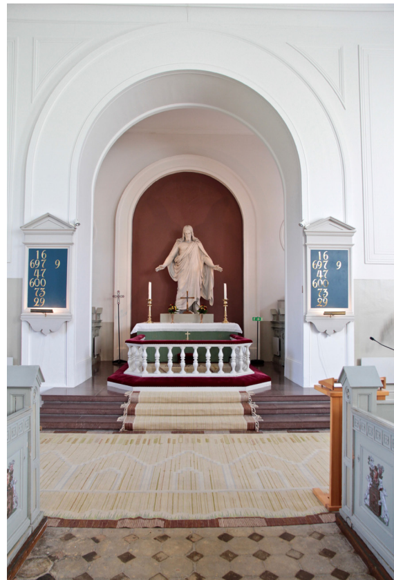
Triumfbågen mot koret och dess kopia av Thorvaldsens Kristusstaty.

Långhusets präglas av rymd och ljus, typiskt för nyklassicistiska kyrkobyggnader. Över rummet spänner ett stickbågigt tunnvalv med vita fältindelningar på grå botten. I gavelpartierna, över den taklist som löper runt hela rummet, finns rundbågiga blinderingar.