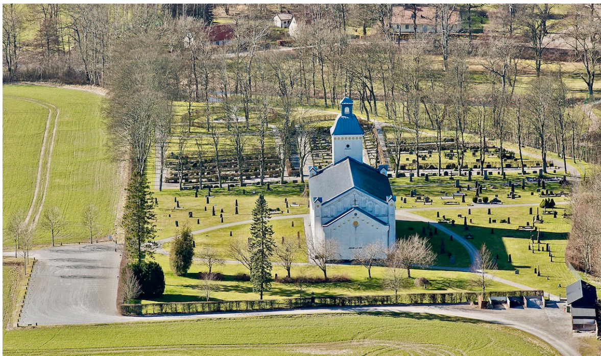
Trolleås kyrkogård från öster. Närmast kyrkan finns den äldre delen av kyrkogården medan 1925 års utvidgning och den på 1990-talet tillkomna minneslunden syns i väster. Foto: Pär-Martin Hedberg, 2014.

Den hästskoliknande avenboksformationen skulle också kunna tolkas som planformen för en kyrka, med tilltaget långhus, smalare kor och halvrund absid. I länsarkitekt Nils A. Blancks originalritningar avslutas den planlagda delen av kyrkogården rakt i öster i höjd med "koret" genom en rad lönnar ur vilken "absiden" skjuter ut. Emellertid