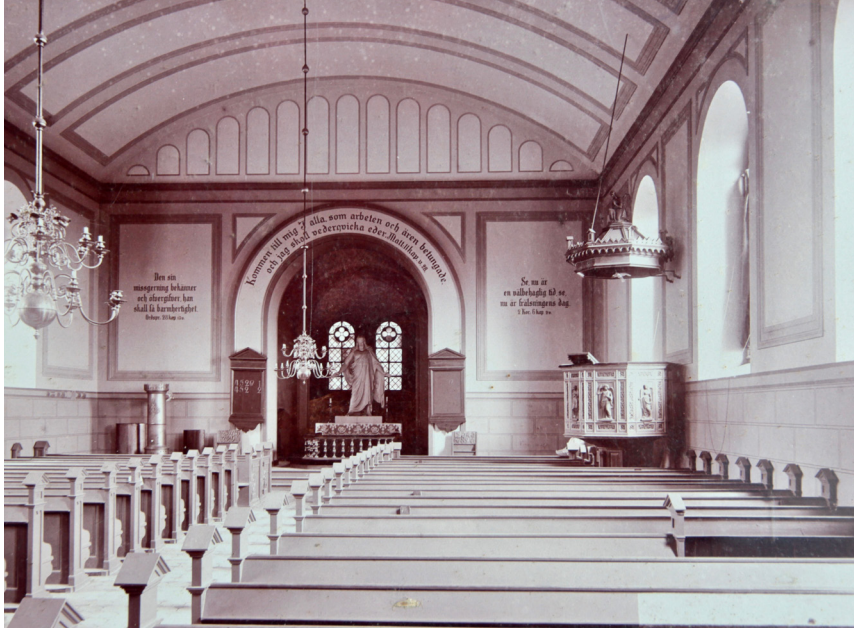
Interiören fotograferad vid okänd tidpunkt, före restaureringen 1939. Notera interiörens färgsättning, där väggfält och blinderingar framhävs och bröstningen har kvadermålning, typisk för andra hälften av 1800-talet.

iskt grepp för Græbes restaureringar. Bänkinredningen kortades för att skapa gångar utmed ytterväggarna och ryggstöd, fotstöd och psalmbokshållare justerades. Långhusets nordvästra respektive sydöstra hörn byggdes in med kloasongväggar för att skapa utrymmen för bårum samt orgelläktarens trappa som i och med detta också ändrades.