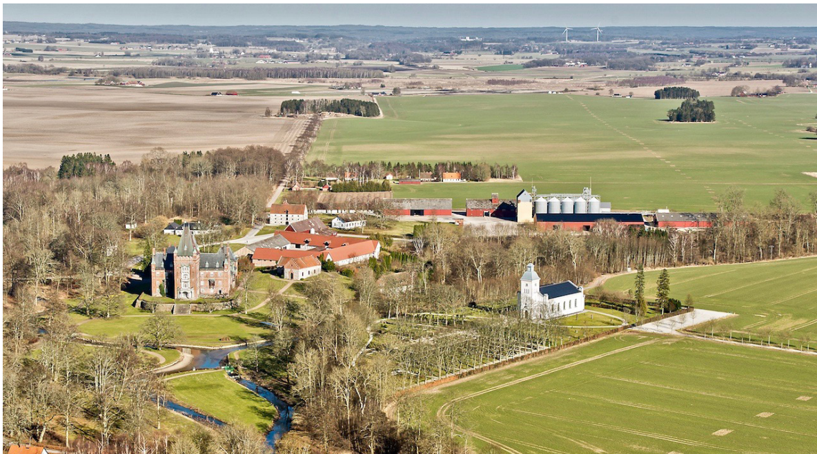
Flygbild över Trollenäs tagen från sydväst.

Namnet Näs kommer från den landstunga mellan två armar av Saxån, strax norr om det höjdrön där Trollenäs kyrka anlades 1860. På näset fanns på 1000-talet och möjligen ännu tidigare en befästning, dock tidigast belagt i skrift på 1300-talet. Under 1100-talet uppfördes Näs kyrka i dess direkta närhet. Godset har endast ägts av två ätter, Thott, där Tage Ottosen Thott var den som 1559 lät uppföra det nuvarande slottet, och Trolle, som genom byte 1682 kom i besittning av egendomen. Slottet byggdes på sent 1800-tal om till det franskinspirerade renässansslott vi ser idag, efter ritningar av den danske arkitekten Ferdinand Meldahl. Sockenens socken gick fram till 1899