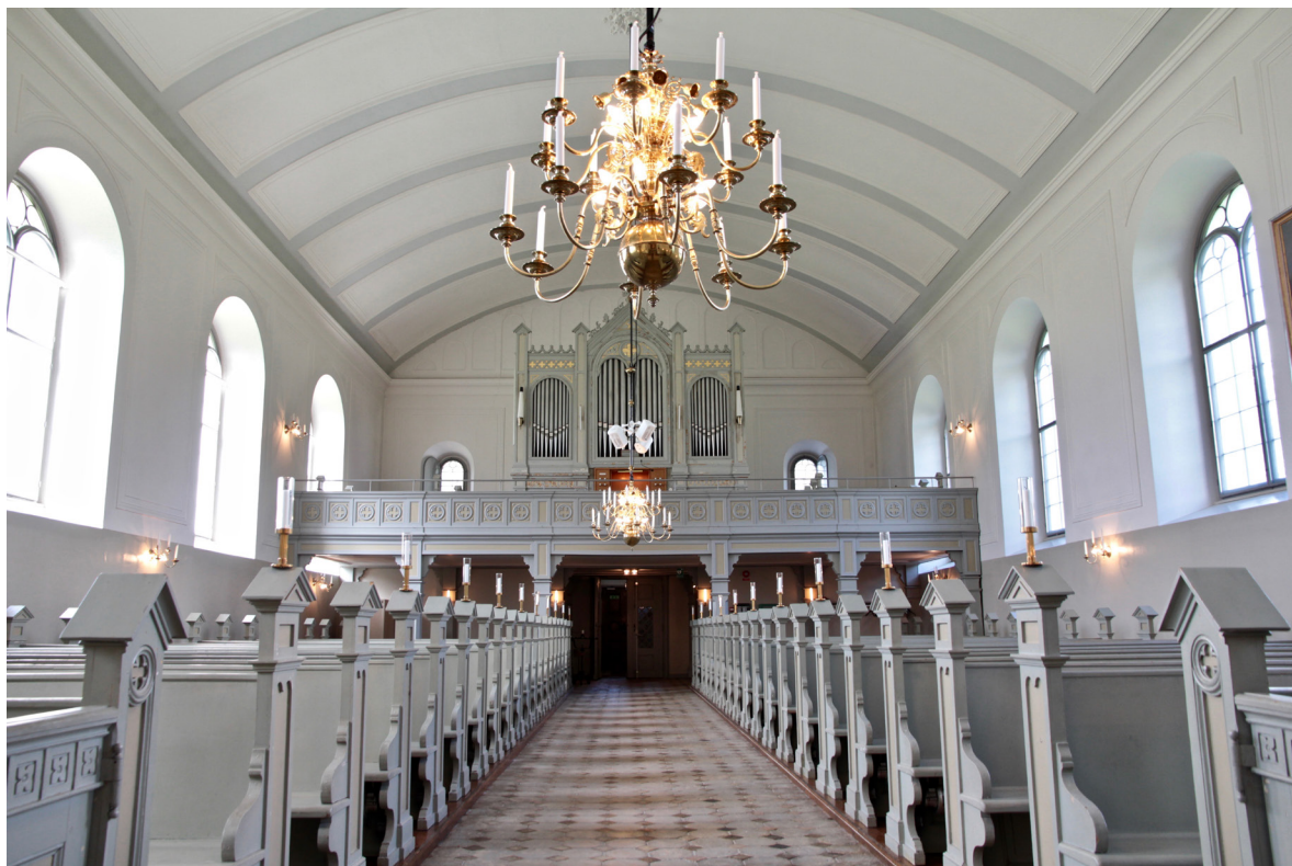
Kyrkorummet mot väster med orgelläktaren och orgelfasaden med drag av nygotik.

Koret är beläget tre trappsteg högre än långhuset och nås via den rundbågiga triumfbågen. Trappan är liksom korets golv belagt med röd ölandskalksten. Väggarna är slätputsade och vitmålade medan taket är ett putsat tredingstak med fältindelning likt långhuset men är här endast målat i vitt. I östväggen över altaret finns en stor rundbågig nisch vars botten är målad i brunröd kulör och som tillsammans med en kopia av Thorvaldsens Kristusstaty fungerar som altarpopsats. Nischen flankeras av stora profilerade medaljonger, vilka även återfinns i väggen åt väster. Mot utgångarna i norr och söder är golvnivån nedsänkt. Utrymmena fungerar som sakristior vilka i söder nås av en gjuten trappa belagd med röd kalksten och i norr via en trätrappa. Sakristiorna avskiljs även av gråmålade skärmväggar vars formspråk går igen från bänkinredningen (se Inredning och inventarier ). Dörren i norr är igensatt inifrån och döljs även av ett textilskåp.