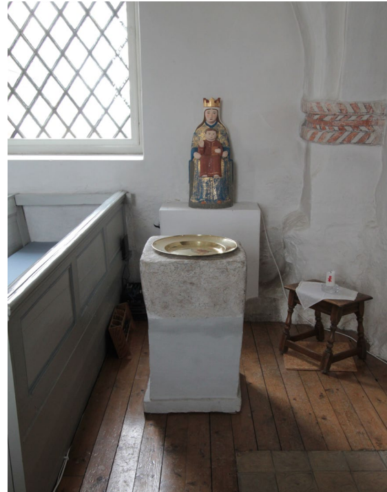
Dopfunten tros på grund av sin ovanliga utformning vara ett tidigare vigvattenskärl.

Dopfunten i sandsten är medeltida men tros ursprungligen ha fungerat som vigvattenskärl. Den firsidiga foten som murades i tegel 1822, i samband med att funten tillkom kyrkan alternativt började brukas som dopfont, är gråmålad och försedd med en fals nertill. Även cuppan är firsidig och försedd med en mindre urholkning utan avtappningshål. Till dopfunten används en dopskål av nysilver.