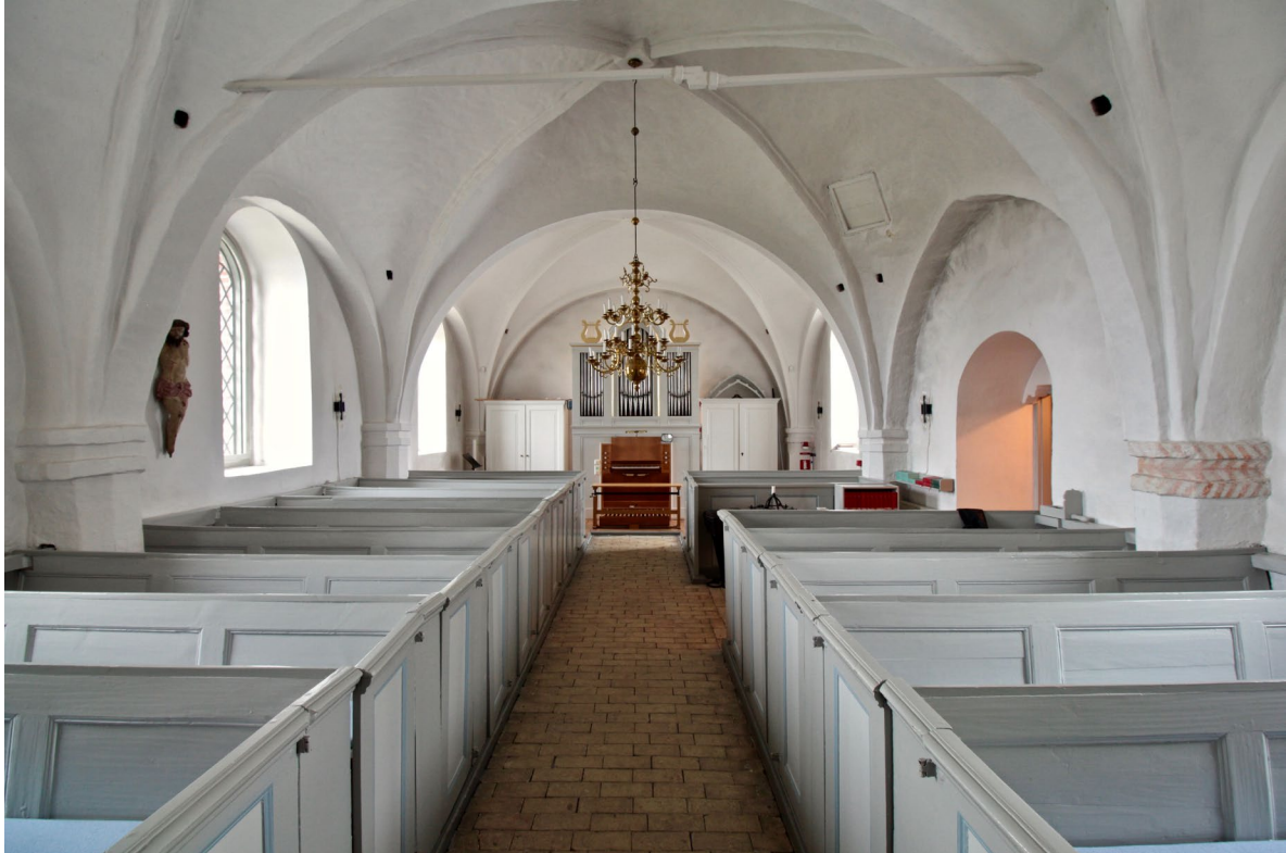
Det medeltida långhuset förlängdes med en valvtravé i väster 1846, där orgeln idag är placerad. Notera den lilla luckan i mittersta travéens valvsvickel, som utgör enda uppgången till kyrkvinden.

kad 1967 av Hillevi Kjellhard-Nilsson. Väggarna och kryssvalvet, som på stilhistorisk grund bedömts vara ett hundratal år yngre än de medeltida långhusvalven, är putsade och vitkalkade. I korvalvet, triumfbågen och på långhusets valvpelare finns bevarade kalkmålningar i rött, blått och svart. I triumfbågen står två stolar i gustaviansk stil som skänktes till kyrkan 1962. Eric Alsmarks glasmålning i korfönstret, som fungerar som altartavla, framställer Jesu bergspredikan i klara blå, gröna och gula kulörer.