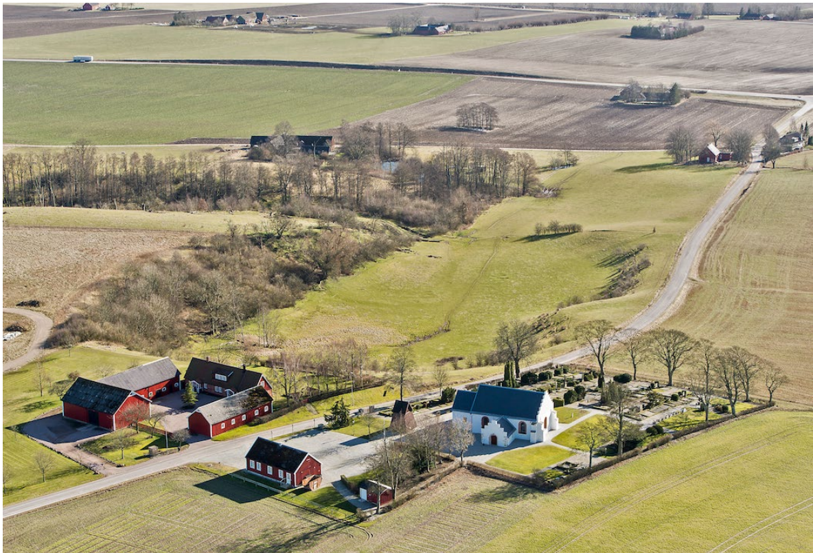
Flygbild över Östra Karaby kyrka 2014, tagen från nordväst.

Östra Karaby ligger på en höjd i fullåkersbygden norr om stationssamhället Marieholm där det kustnära slättlandskapet möter det inre böljande backlandskapet. Från kyrkan som är belägen cirka 90 meter över havet är utsikten milsvid. Den bördiga jorden och närheten till Saxån gjorde att trakten tidigt exploaterades av människan och socknen är rik på lämningar från förhistorisk tid. I skriftliga källor förekommer Östra Karaby från 1200-talets mitt, men ändelsen -by i Ortsnamn (förleden kommer troligen av mansnamnet Karl eller karl i betydelsen man eller fri man) anses vanligen ha sitt ursprung någon gång mellan folkvandringstid och vikingatid. Möjligen har då en by eller storgård etableras på platsen, och vissa tecken tyder på att den även kan ha fungerat som häradscentrum och tingsplats. Den trädbevuxna ravin som ligger strax sydost om kyrkan, kallad Karaby lund, tros dessutom ha fungerat som offer- och kultplats under förkristen tid.