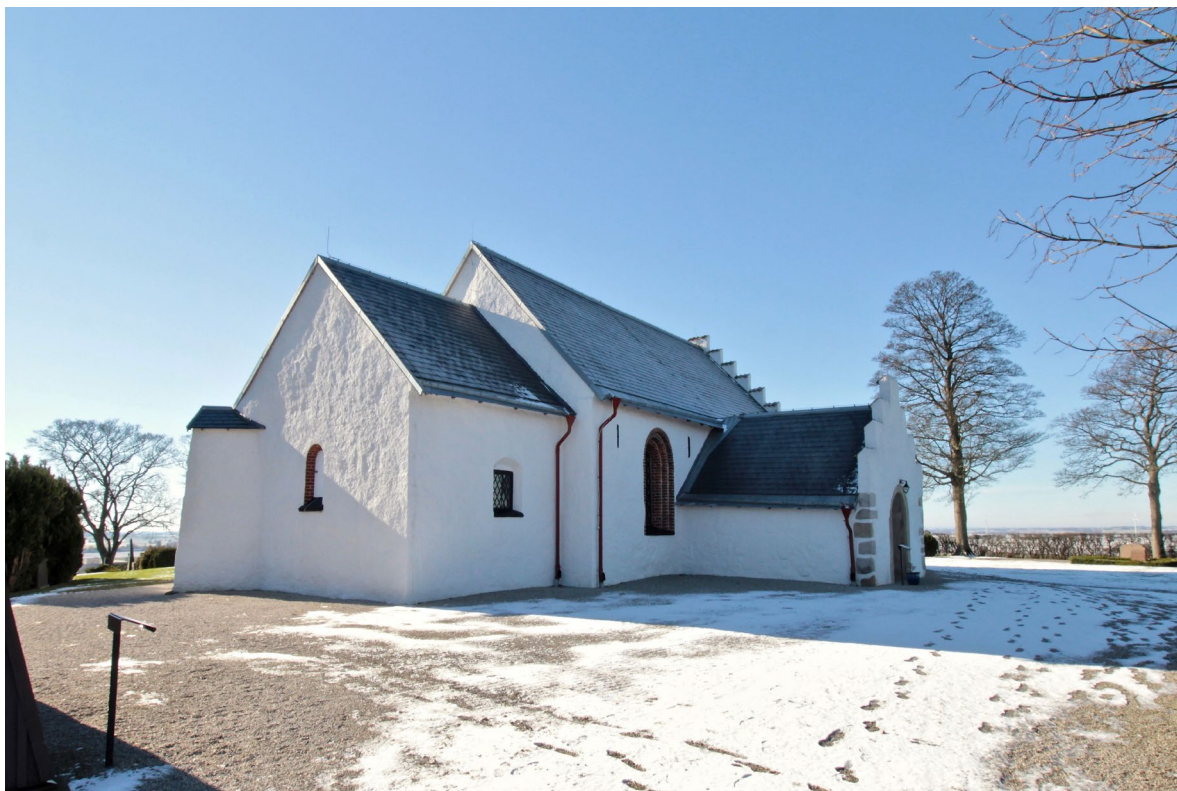
Kyrkan från nordost, med vapenhuset i norr och den kraftiga strävpelaren i korets sydöstra hörn.

Fasaderna är spritputsade och målade med vit silikatfärg medan sadeltaken är avtäckta med skiffer. Plåtarbeten är utförda i galvad plåt frånsett hängrännorna som är av rödmålade plåt. Långhusets västgavel och vapenhusets norrgavel är murade med trappsteg och gotiska blinderingar. Vid takfoten avslutas långhusets och korets fasader med en