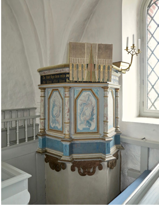
Predikstolen i långhusets sydöstra hörn.