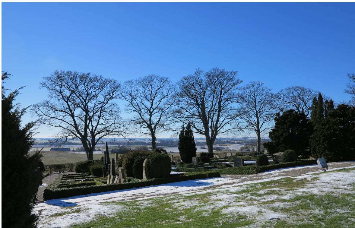
Kyrkogården utvidgades åt söder 1847, där flera gravstenar ännu är av äldre karaktär.

Växtligheten är sparsmakad och består främst av städsegröna buskar och träd som tuja och en. Runt kyrkogården löper en rad av lindar, utanför vilka den nyare delen av kyrkogården omgärdas av klippta häckar medan den äldsta delen avgränsas av en putsad gråstensmur avtäckt med stora stenhällar. Rakt öster om koret finns kyrkogårdens tidigare huvudentré, en öppning i murverket med grind av smidesjärn och grindstolpar av murad sandsten. Norr om denna finns ytterligare en grind för en tidigare körväg som idag är igenväxt.