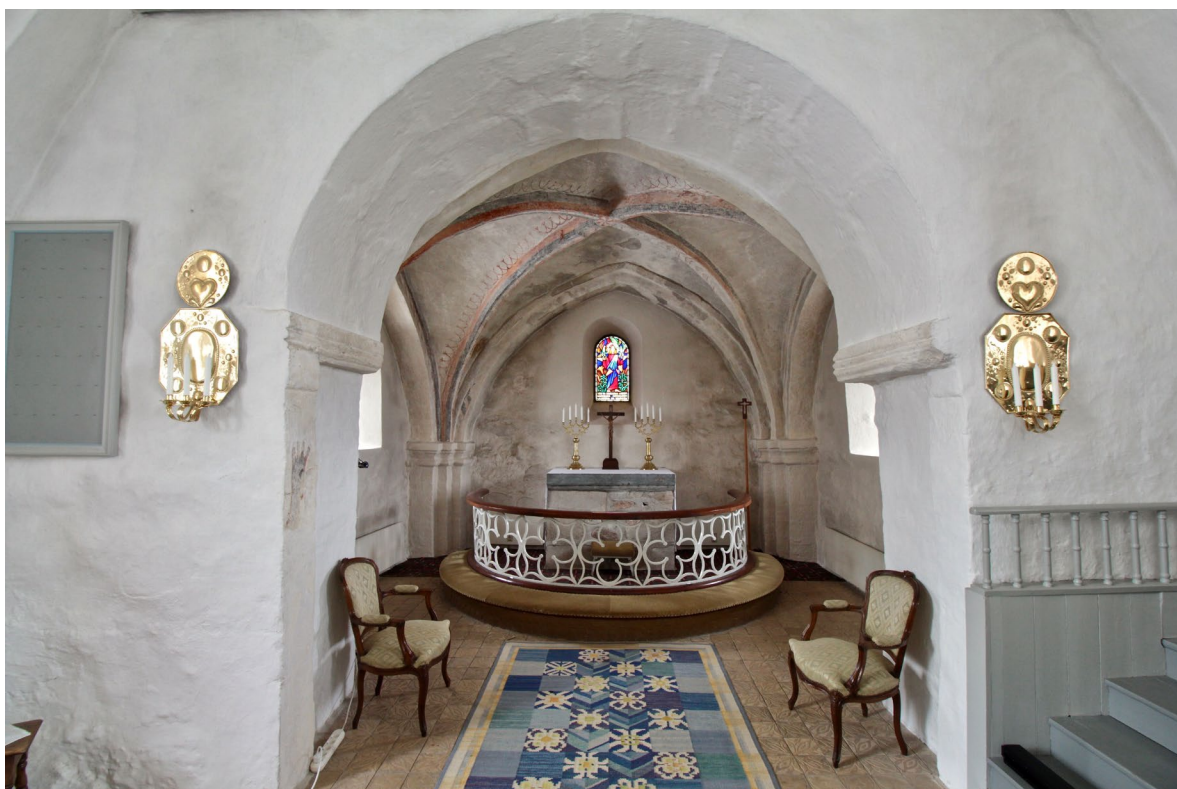
Koret i öster med senmedeltida kalkmålningar och altaret som möjligen är kyrkans ursprungliga. Eric Alsmarks glasmålning i korfönstret från 1947 fungerar som altartavla.

Altarkrucifixet av slätt brunmålat trä tillverkades 1947. Kristusfiguren är av gotisk typ och krucifixet står på en rektangulär profilerad fot. Under påsken ersätts altarkrucifixet av ett enkelt altarkors i trä.