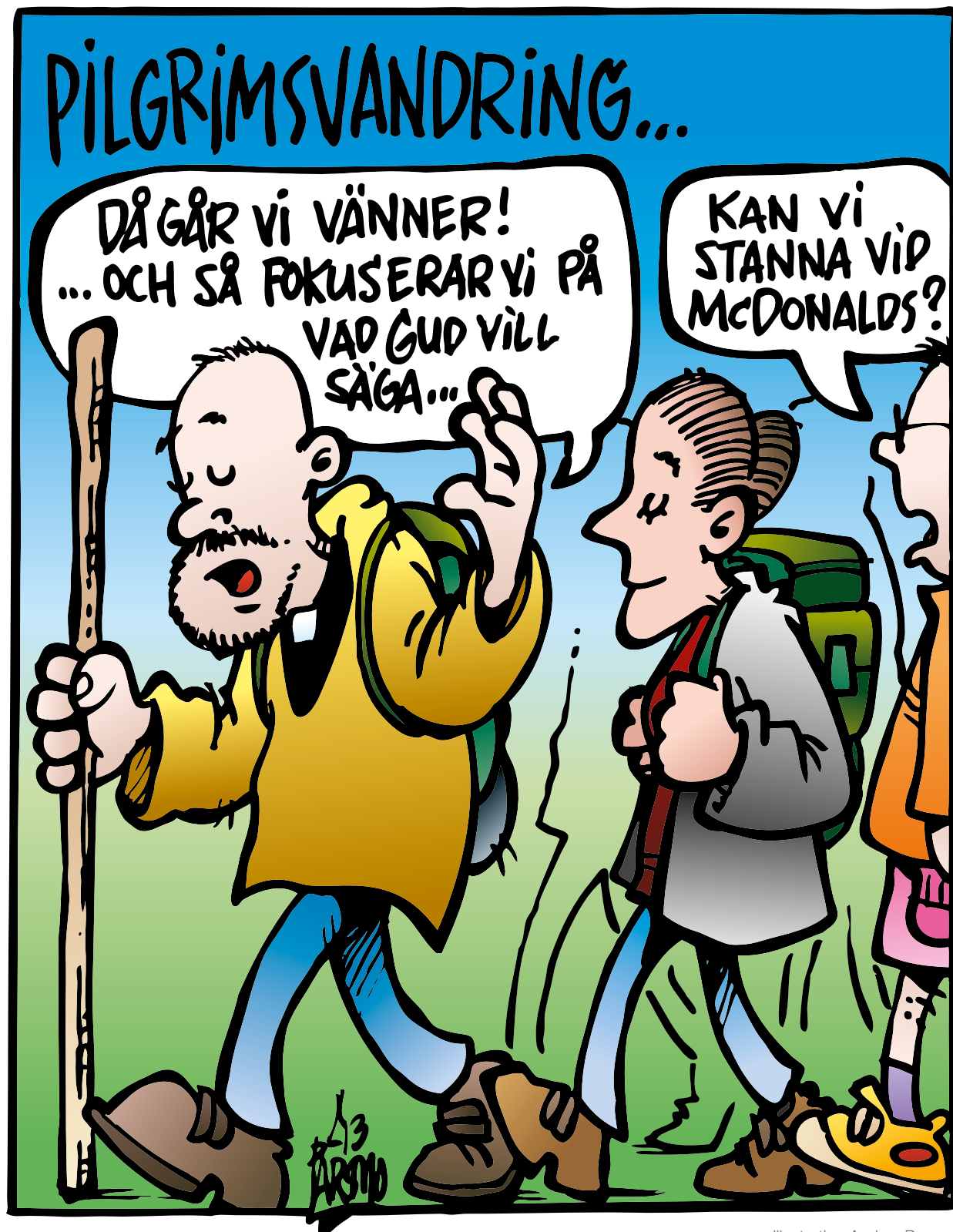
Illustration Anders Parsmo