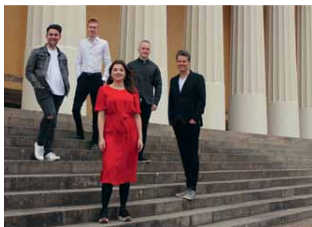
Voice of heart

21 juni Musik i midsommarnatten, Ärentuna kyrka • 30 juni Den hemliga trädgården, Lena kyrka • 14 juli Folkmusik i sommarkvällen, Tensta kyrka • 28 juli Somnardröm, Ärentuna kyrka • 11 augusti Klassisk musik och folkmusik på flöjt och harpa, Katarinakapellet • 25 augusti Sång till friheten, Storvreta församlingsgård