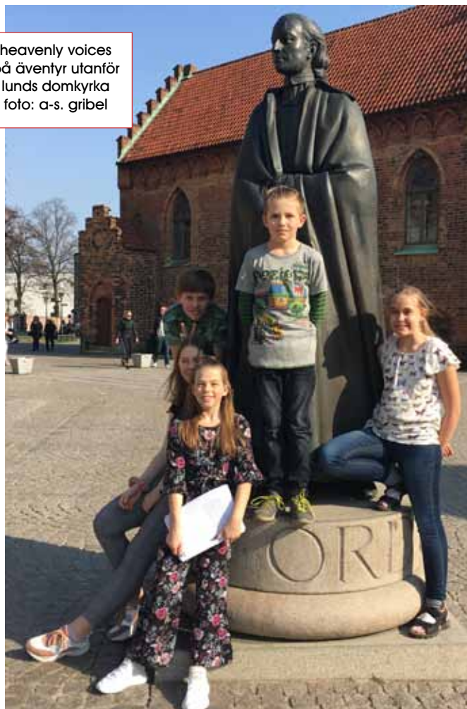
heavenly voices på äventyr utanför lunds domkyrka foto: a-s. gribel