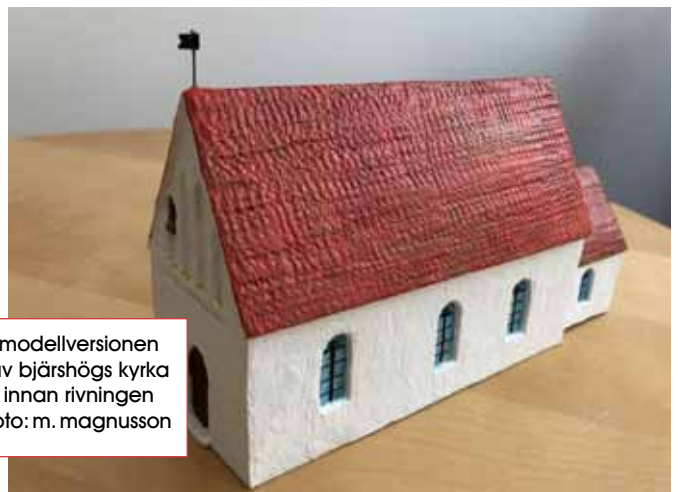
modellversionen av bjärshögs kyrka innan rivningen