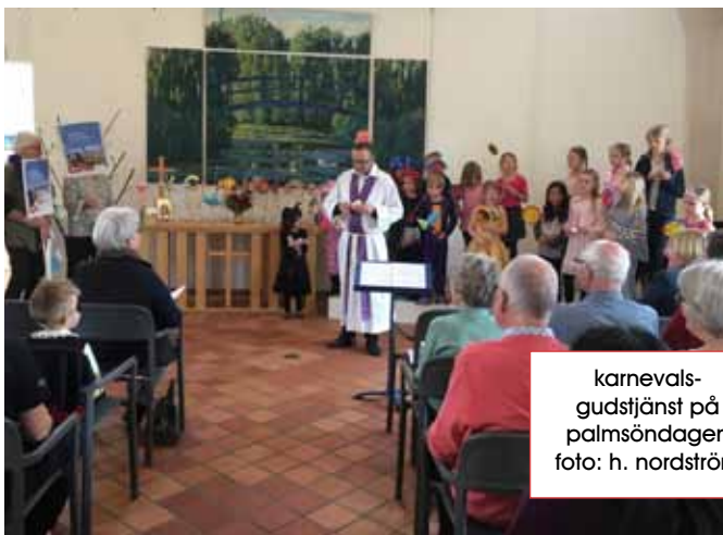
karnevals-gudstjänst på palmsöndagen