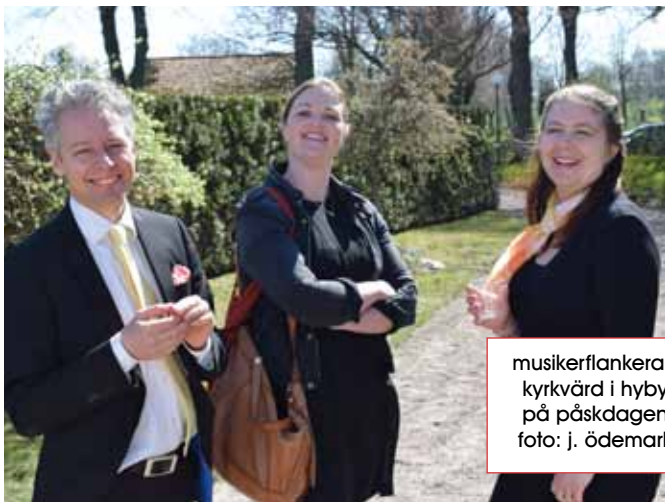
musikerflankerad kyrkvård i hyby på påskdagen