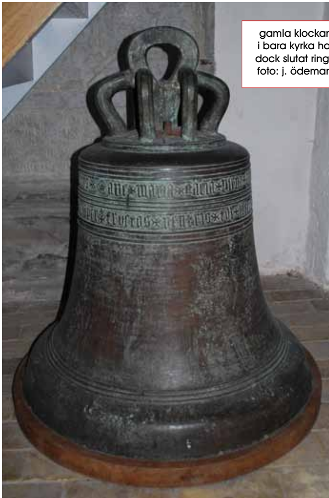
gamla klockan i bara kyrka har dock slutat ringa