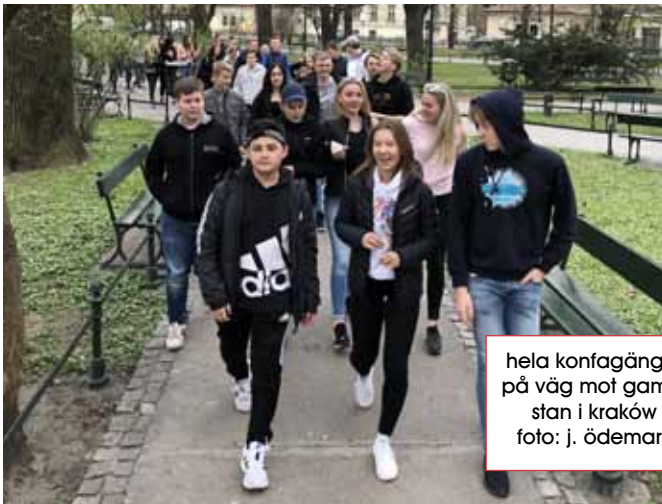
hela konfagänget på väg mot gamla stan i Kraków