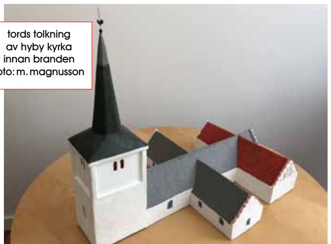
tords tolkning av hyby kyrka innan branden