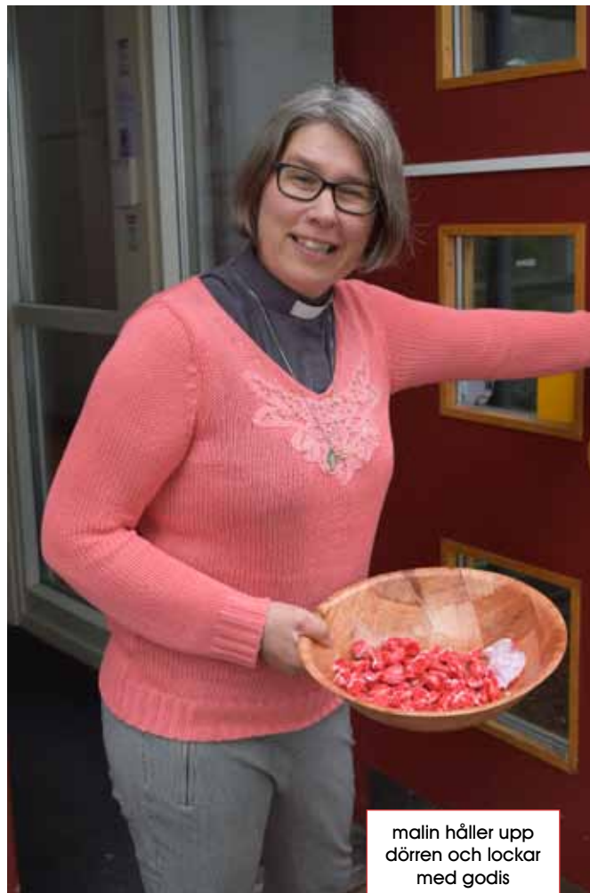
malin håller upp dörren och lockar med godis

Favoritbok eller -författare: Det har blivit många genom åren... de senaste böckerna handlar om kristna personligheter, hur de lever sina liv och deras tankar om tro.