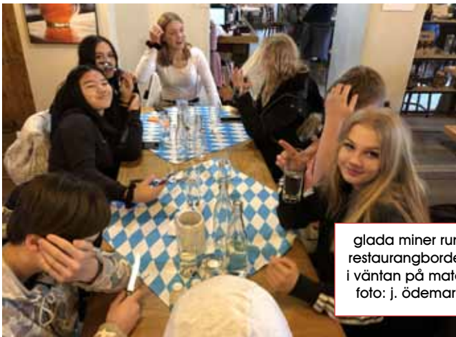
glada miner runt restaurangborden i väntan på maten