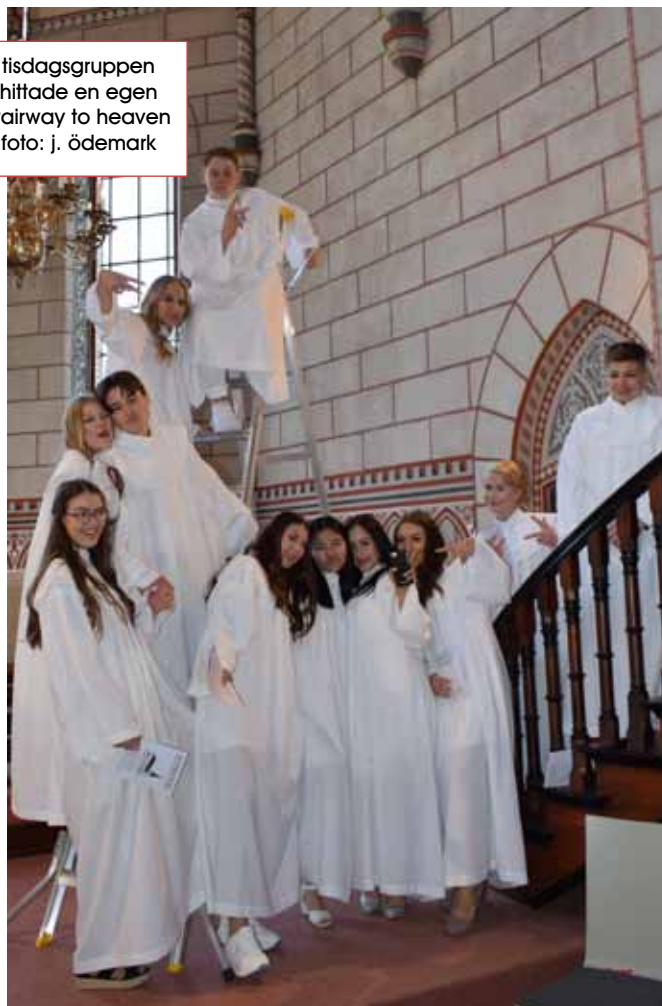
tisdagsgruppen hittade en egen stairway to heaven