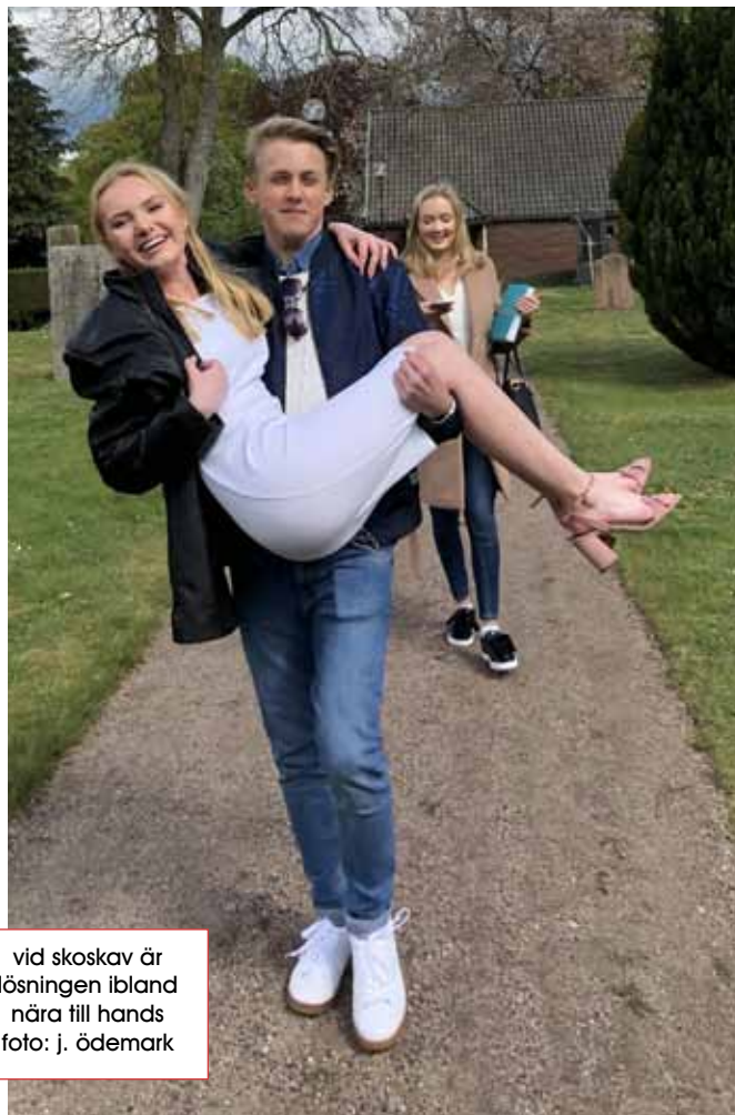
vid skoskav är lösningen ibland nära till hands