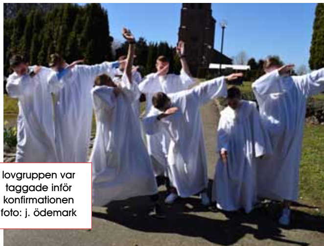
lovgruppen var taggade inför konfirmationen