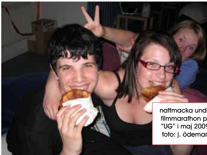
nattmacka under filmmarathon på "UG" i maj 2009.