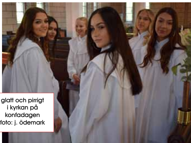
glatt och pirrigt i kyrkan på konfadagen