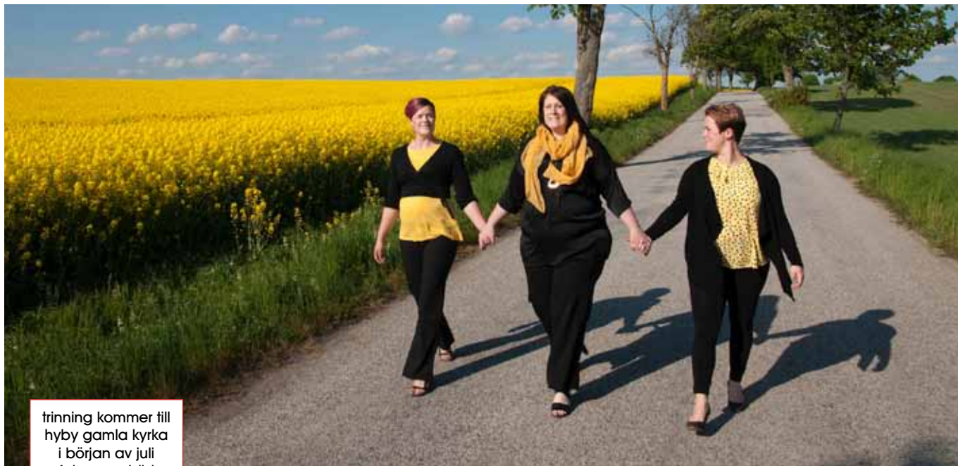
trinning kommer till hyby gamla kyrka i början av juli