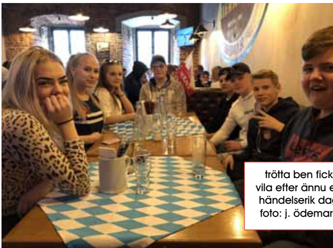
trötta ben fick vila efter ännu en händelserik dag