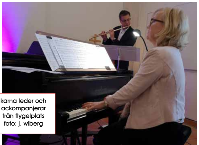
karna leder och ackompanjerar från flygelplats