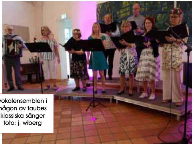
vokalensemblen i någon av taubes klassiska sånger