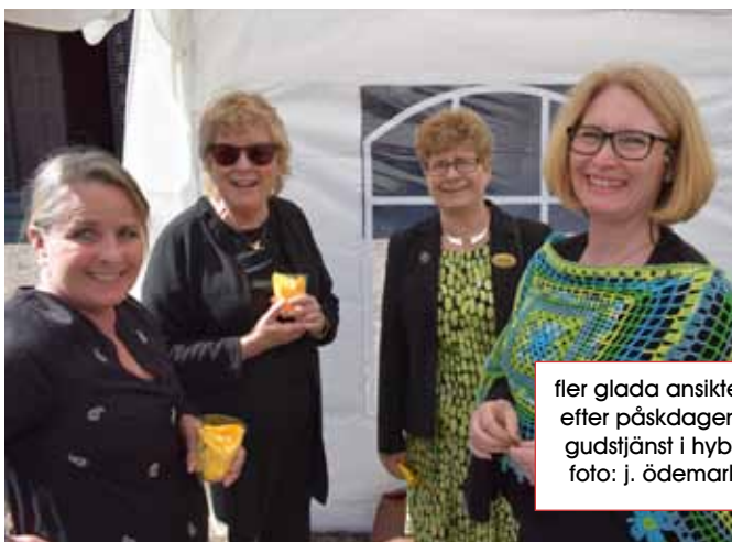
fler glada ansikten efter påskdagens gudstjänst i hyby