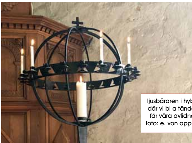
ljusbäraren i hyby där vi bl a tänder får våra avlidna