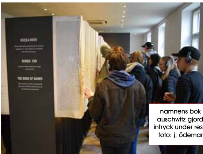
namnens bok i Auschwitz gjorde intryck under resan