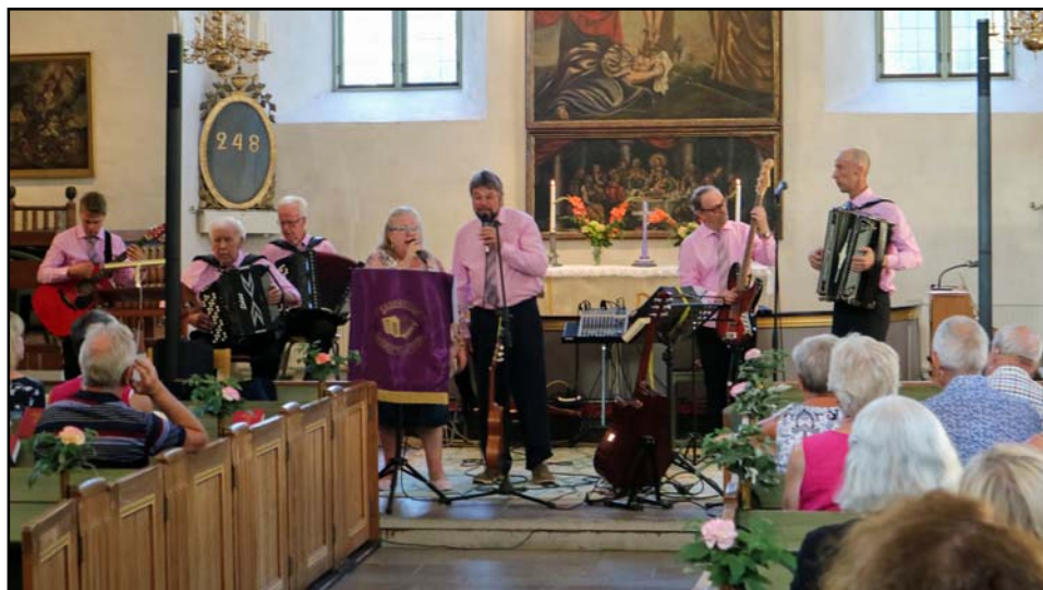
Dagsbergs dragspelsgäng i Farledskyrkan i Skällvik den 25 juli 2018.