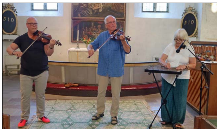
Lis-Jons kapell spelar i Skällviks kyrka.