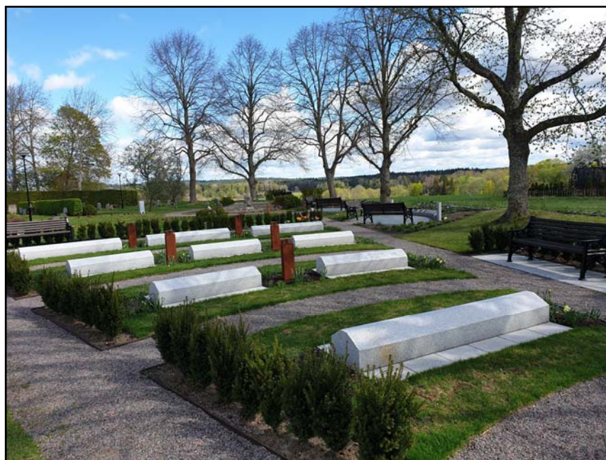
Skönberga askgravplats våren 2019.

Under hösten kommer flertalet av våra kyrkogårdar att få nya vattenposter. De befintliga har funnits i många år och behöver förnyas. I samband med att de byts ut kommer de nya vattenposterna att göras mer tillgänglighetsanpassade. Alla av församlingens kyrkogårdar har endast vatten tillgängligt vår, sommar, höst då alla ledningar ligger så pass grunt att de fryser