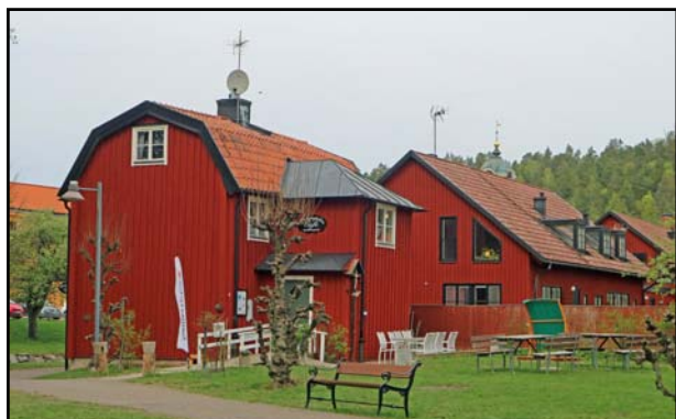
Klockaregården en regnig dag i maj 2019.