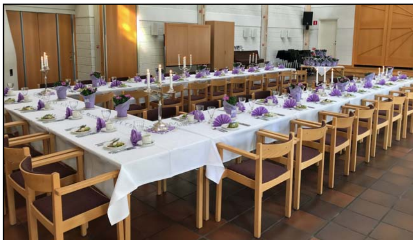
Vårens 80-årskalas dukas i syrenlila.