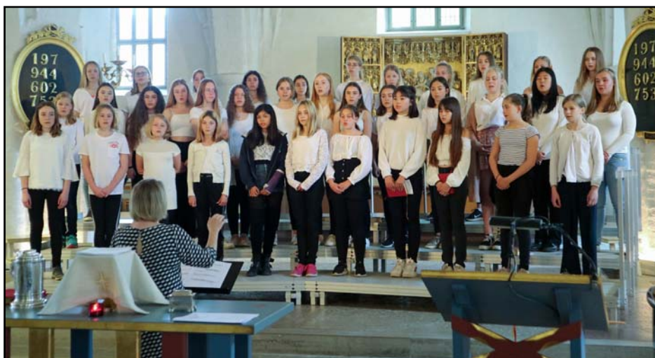
Körsångare från Cecilia-kören, Åkersberga, Älvsborgs diskantkör, Göteborg och Tonhöjderna från Norrköping.

dirigerades av Catarina Eckerdal samt Tonhöjderna från Norrköping under Ann Törnqvists ledning. Repertoaren var gemensam och den vackra körsången belönades med livliga applåder från församlingen.