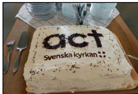
Act-tårten vid kyrkkaffet söndag 5 maj.

Den 5 maj 2019 bytte "Svenska kyrkans Internationella arbete" namn till "Act Svenska kyrkan". "Act" betyder "agera" på svenska. "Act Svenska kyrkan" är en del av ACT-alliansen, Action by Churches Together, ett samarbete mellan kyrkor och trosbaserade biståndsorganisationer i världen.