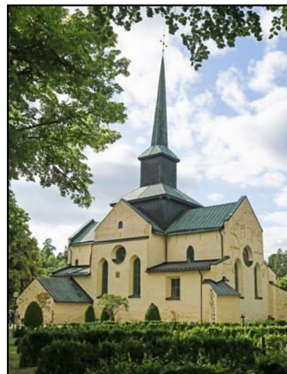
Skällviks kyrka från klockstapeln.