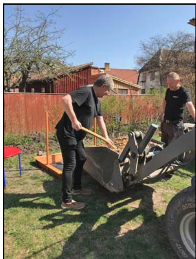
På Klockaregårdens Café har numera anlagts en sandlåda för de minsta. Där kan de leka en stund efter familjefikat.