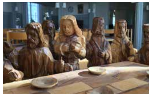
Nattvardsscenen i trä fick också vara med på familjekvällen med pannkaksfest.

● Sedan i februari erbjuder Älvkarleby Skutskärs församling både samtalsgrupp, mingelfika och sinnesromässa i Skutskärs kyrka första söndagen i månaden. En öppen samtalsgrupp träffas klockan 14 på eftermiddagen under temat 12 steg till att leva med ansvar och frihet. Klockan 15.30 bjuds på mingelfika och en timme senare, klockan 16, hålls sinnesromässa i Skutskär med musik och sång med ett husband, delande, förbön och ljusständning, nattvardsmåltid med bröd och druvjuice.