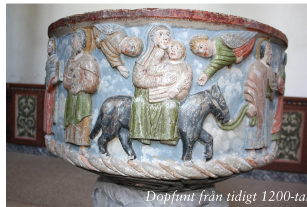
Dopfont från tidigt 1200-tal

Foten har utsmyckats med fyra huvuden i rundskulptur, och mellan dem människo- och djurfigurer i relief. Cuppan tillskrivs Calcarius Secundus och foten till mästaren Calcarius Primus. År 1707 färgglades dopfunten.