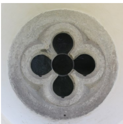
Fönster i sakristian

Kvar i sin helhet från den första kyrkan är kyrktornet med sina rundbågiga ljudöppningar. I mitten av 1200-talet inleddes ombyggnaden med ett nytt kor och första delen av nuvarande långhuset. Efter några decennier färdigställdes kyrkan till en tvåskeppig hall med sex kryssvalv. Samtidigt byggdes även sakristian med sitt vackra fyrpassfönster. Skarven mellan