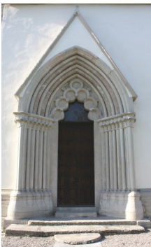
Långhusportalen i gotisk stil

Vid bänkarnas uppförande tillämpades fortfarande att kvinnor och män satt åtskilda - kvinnorna på norrsidan och männen på sydsidan. Vid en restaurering 1923 täcktes målningarna med de akantuslingor som idag pryder