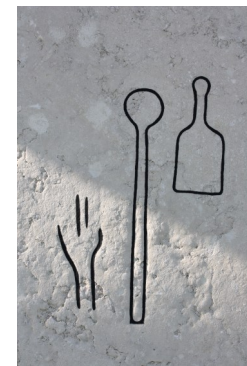
Medeltida gravsten med pilgrimssymboler

Till kyrkan hör prästgården där flertalet byggnader har rötter i tidigare århundraden. På kyrkogården står ett sockenmagasin, en slags spannmålsbank som inrättades i Sverige under nödåren på sent 1700-tal. Vid magasinets vägg står flera medeltida gravstenar.