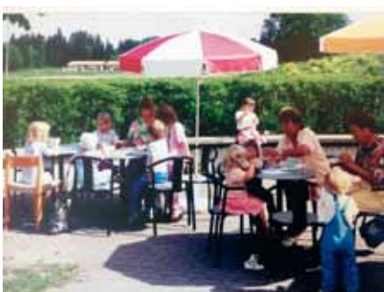
Utanför ingången fanns en stenlagd rundel med häck och på fotot ser vi cafébord i denna rundel.