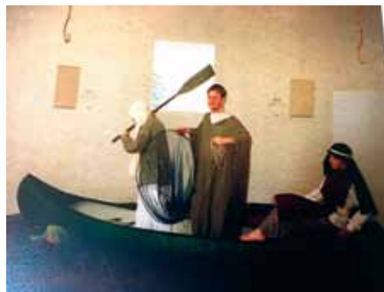
Kyrkans unga träffades regelbundet och hjälpte även till med olika dramatiseringar. Här är det fiske vid Gennesarets sjö inne i kapellet.