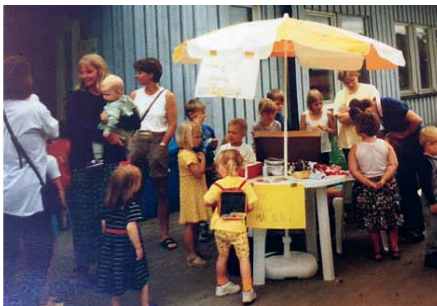
Midsommarfirande från 1997 med glasskiosk och fika.