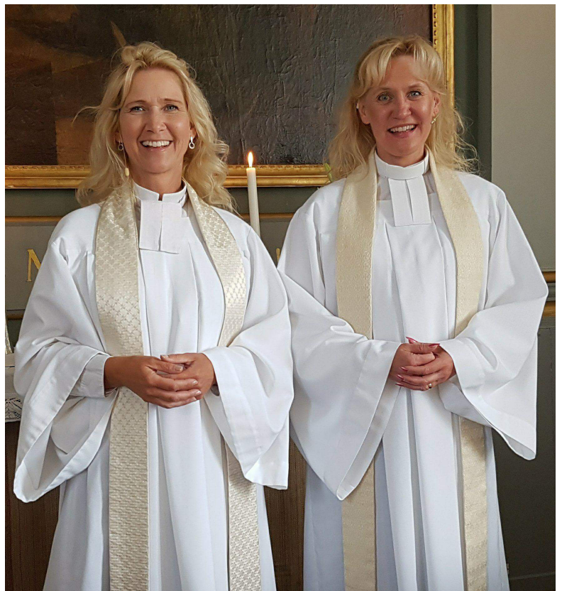
Puff och Piff.