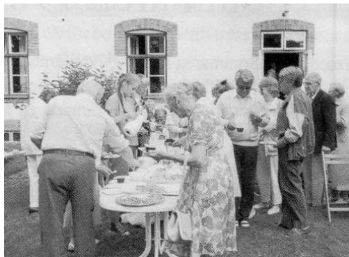
På utflykt med Fritidskyrkan.