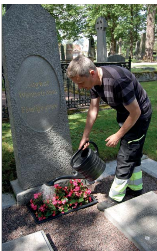
Många gravvårdar står under kyrkogårdsförvaltningens skötselansvar och det gäller att blommor och planteringar får ordentlig tillsyn under den varmaste tiden på året.